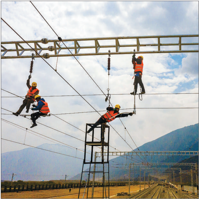
▼中国中铁电气化局集团的技术人员在拉林铁路对接触网进行精调。拉林铁路在建设采用电气化牵引，对保护西藏的自然生态环境，促进绿色发展具有重要意义。