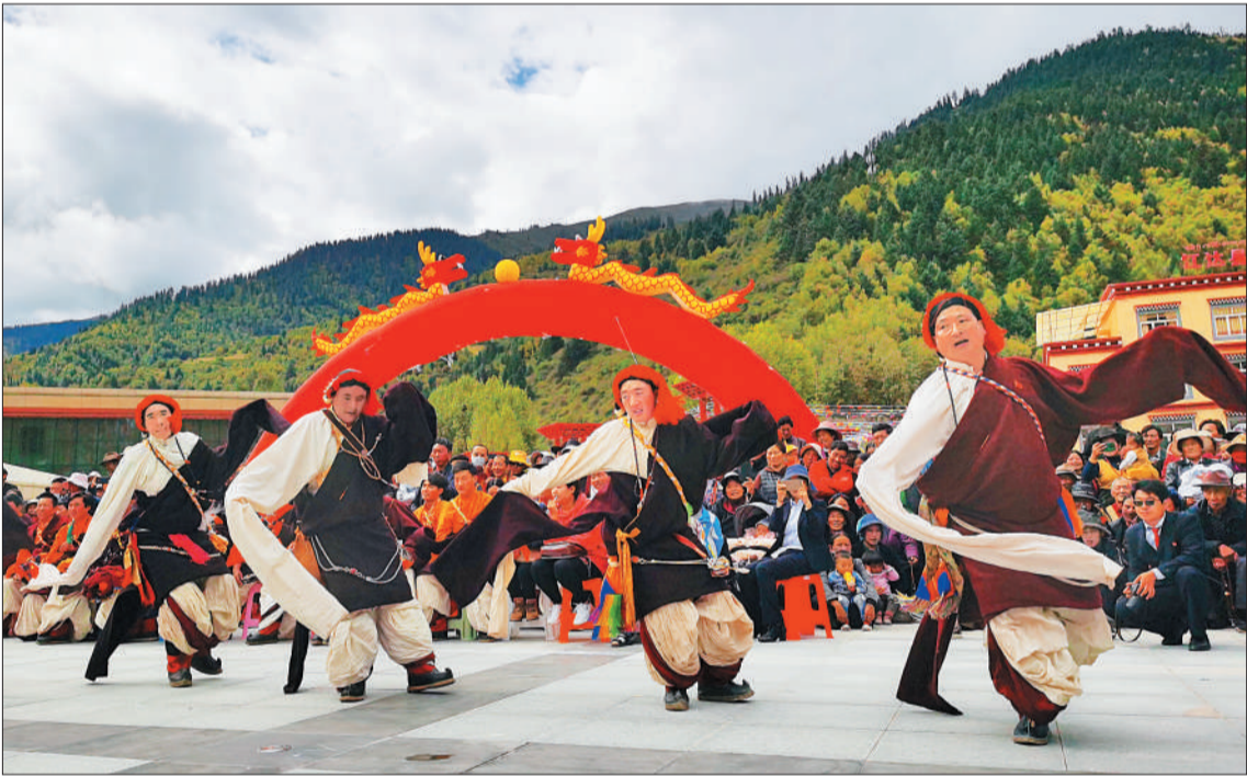
▼昌都市江达县岗托镇的农牧民群众跳起欢快的锅庄。如今，越来越多的农牧民成了野保员、林保员、湿地保护员，保护生态环境就是保护美好家园已成为社会共识。