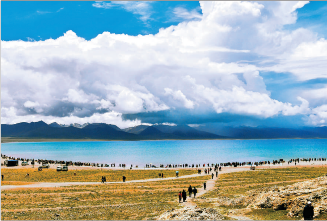
▲游客在纳木错景区游玩赏景。近年来，西藏依托丰富的旅游资源，大力发展生态旅游，做大做强旅游市场。

70年来，西藏始终坚持将生态环境保护作为经济社会发展的红线、底线、高压线，累计向生态环境领域投入资金达814亿元，实施一系列生态保护与建设工程。立足生态环境和自然资源优势，西藏坚持以生态理念谋发展，用生态发展推产业，大力发展旅游文化、高原生物、清洁能源等特色产业，西藏的蓝天碧水和良好生态环境成为全区经济增长的“引擎”，成为群众增收致富的“法宝”。