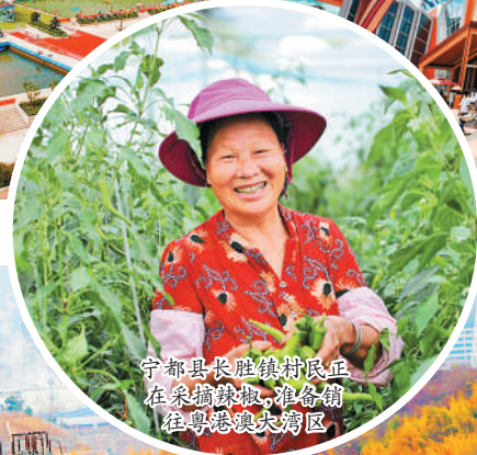
宁都县长胜镇村民正在采摘蔬菜，准备销往粤港澳大湾区