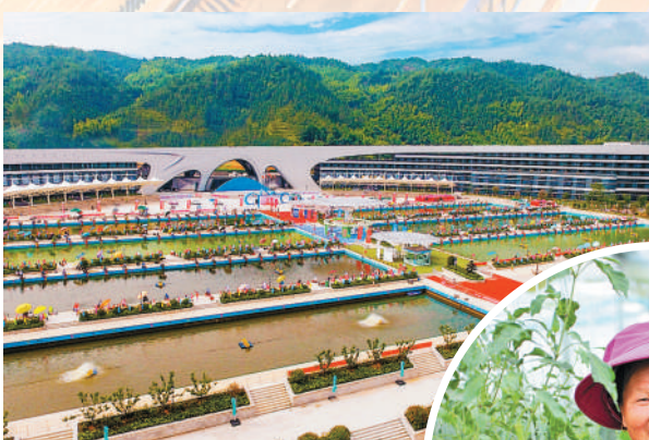
上犹县着力打造康养基地

人才是创新发展的强力引擎。赣州市高度重视人才工作，大力实施人才强市战略，先后出台“人才新政30条”“补充措施18条”以及20多个人才配套措施，明确重点引进和培养100名（个）产业领军人才或团队，引进和培养1000名各领域高层次人才，在创业就业、平台建设等方面