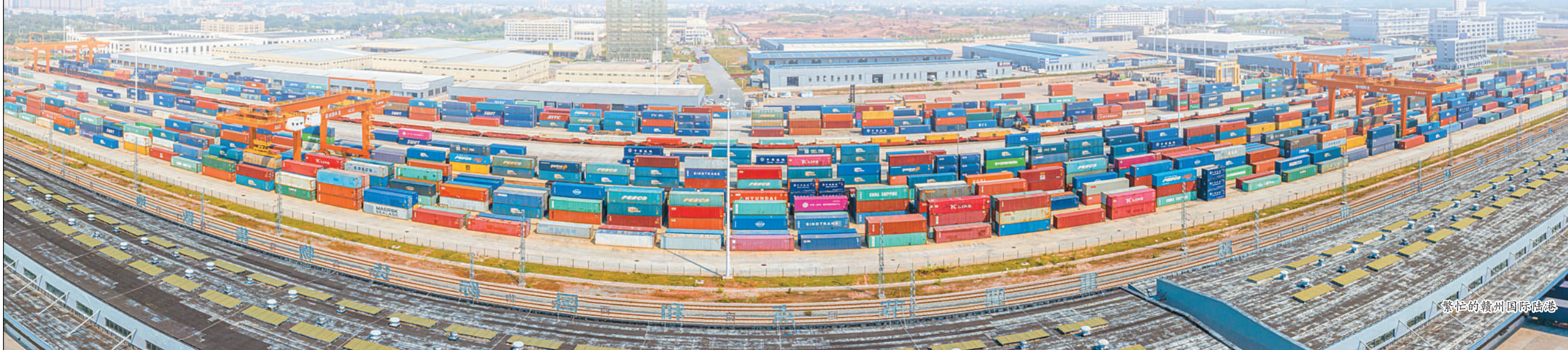
繁忙的赣州国际陆港