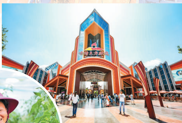
方特东方欲晓主题公园