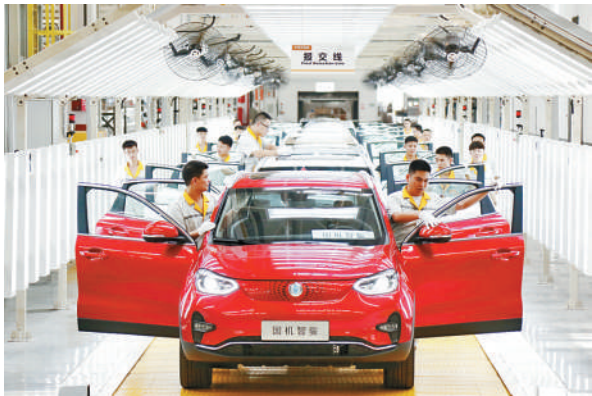
国机智骏汽车有限公司生产车间

赣州推动赣州国际陆港与深圳盐田港共建深赣港产城特别合作区，探索“特区+老区”共赢发展的全国范例。今年4月，赣深“组合港”开通运营暨“双区联动”跨境电商班列开行，成为“湾区+老区”合作的又一重大成果。通过组合港推动通关模式的改革创新，实现了陆海港资源共享共用、业务无缝对接、货物快速通关。此外，还成功开行“深赣欧”班列，率先在全国创建“跨省、跨关区、跨陆海港”的通关新模式。