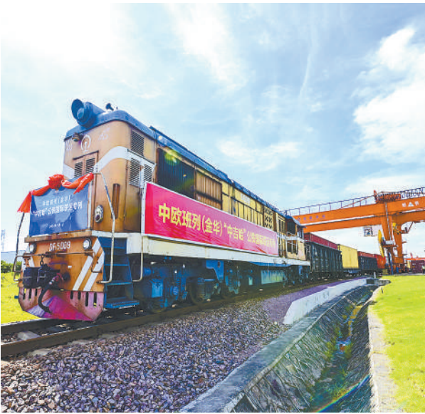
7月16日,满载100标准箱出口货物的“中吉哈”专列×9216/5次从浙江省铁路金华南货场成功首发。“中吉哈”专线的开通,标志着义新欧中欧班列金义新区平台成功打通了一条公铁联运国际贸易新通道。

眼下,“碳中和”概念火热大多还是市场炒作的结果,题材炒作能否经得住考验还要看是否有业绩支撑。