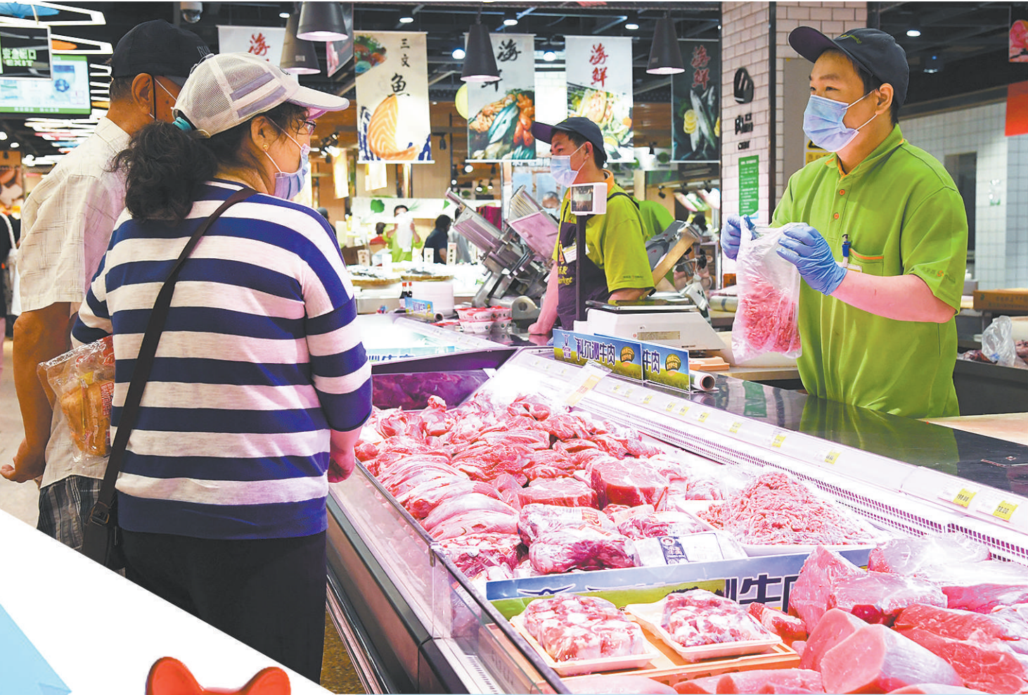
在北京市海淀区的超市发双榆树店,市民在选购鲜肉。

在生猪养殖成本中,饲料占有极高权重。国家是否启动托市收储,参考依据就是猪粮比,即生猪价格与作为饲料的玉米价格之比。根据近年生产成本数据测算,对对应生