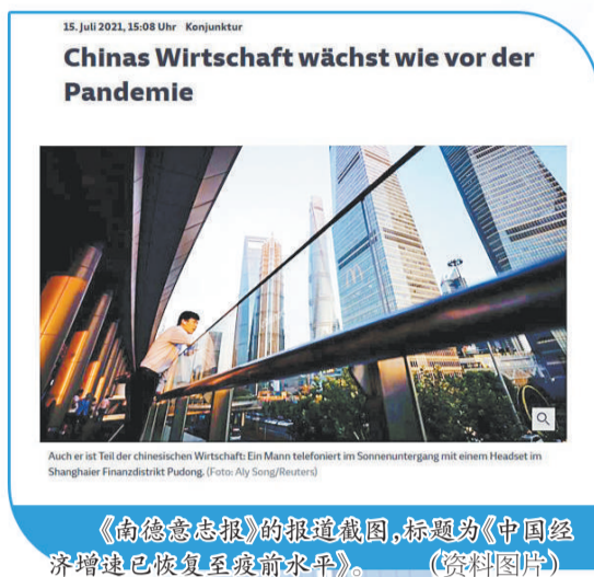
《南德意志报》的报道截图，标题为《中国经济增速已恢复至疫前水平》。(资料图片)

文章还指出，今年6月份中国出口同比增长32.2%，进口同比增长36.7%。对外贸易大幅增长令德国企业受益颇多。在过去半年中许多德国企业对在华取得的业绩感到十分欣喜。报道援引欧盟中国商会近期一项调查指出，中国较世界其他地区更加迅速地战胜了疫情，经济从去年就已经开始复苏，大量欧洲在华企业都从中受益。