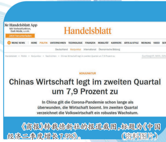
《商报》转载德新社的报道截图，标题为《中国经济二季度增长7.9%》。(资料图片)

尼日利亚中国研究中心主任奥努伊朱在《蓝图报》上刊文称，中国经济基础稳固并实现高质量发展，不仅能确保自身强劲包容性增长，还有助于后疫情时期全球经济复苏。中国始终坚持以人民为中心的发展理念，发展的根本目的是改善民生福祉，这值得非洲国家学习。