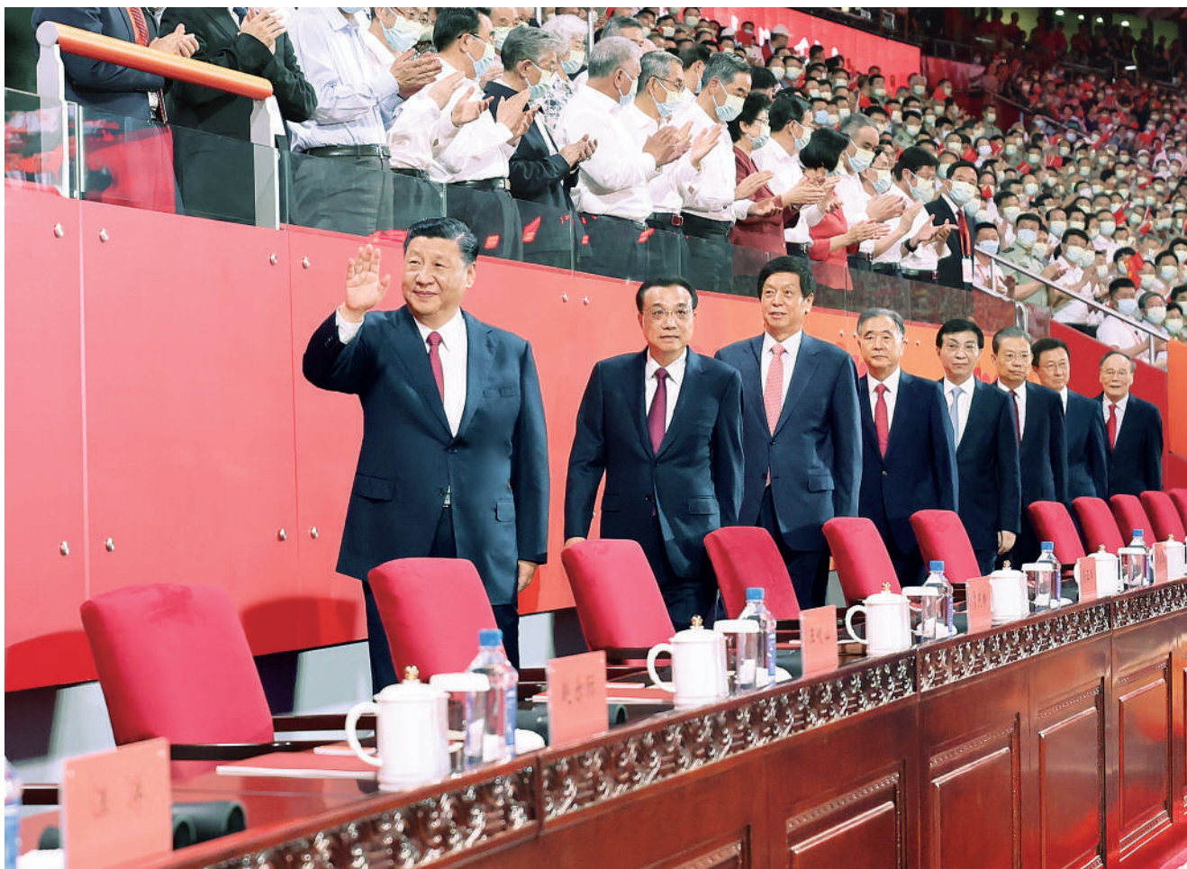
6月28日晚,庆祝中国共产党成立100周年文艺演出《伟大征程》在国家体育场盛大举行。习近平、李克强、栗战书、汪洋、王沪宁、赵乐际、韩正、王岐山等党和国家领导人,同约2万名观众一起观看演出。

带领中国人民站起来的中国共产党,能不能带领人民富起来?党的十一届三中全会胜利召开,作出改革开放的历史