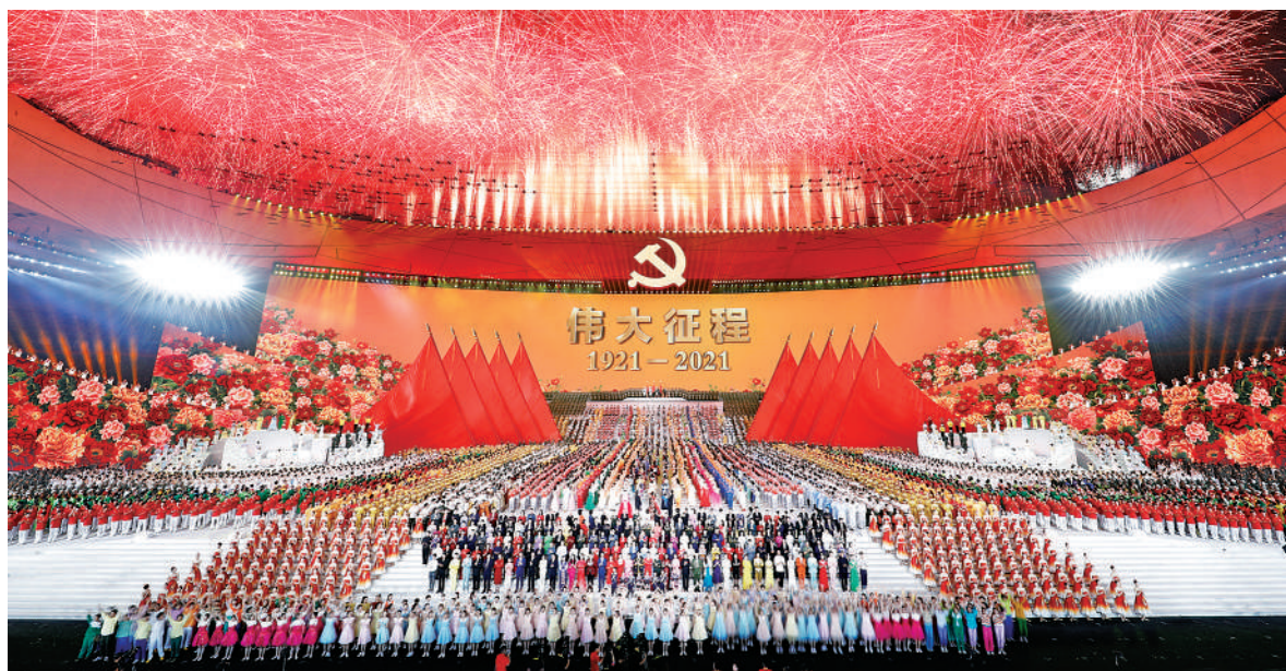
六月二十八日晚,庆祝中国共产党成立一百周年文艺演出《伟大征程》在国家体育场盛大举行。