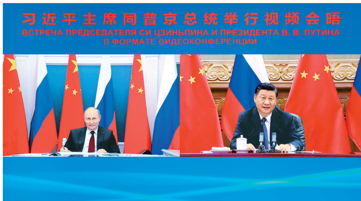
6月28日下午,国家主席习近平在北京同俄罗斯总统普京举行视频会晤。

新华社北京6月28日电 国家主席习近平28日下午在北京同俄罗斯总统普京举行视频会晤。两国元首宣布发表联合声明,正式决定《中俄睦邻友好合作条约》延期。普京热烈祝贺中国共产党成立100周年。