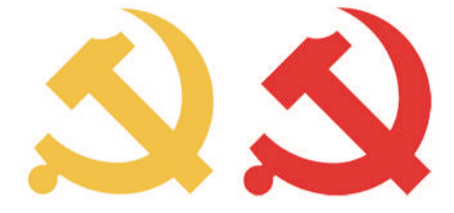
党徽图案标准颜色值：黄色 R=253 G=207 B=48 红色 R=237 G=44 B=37