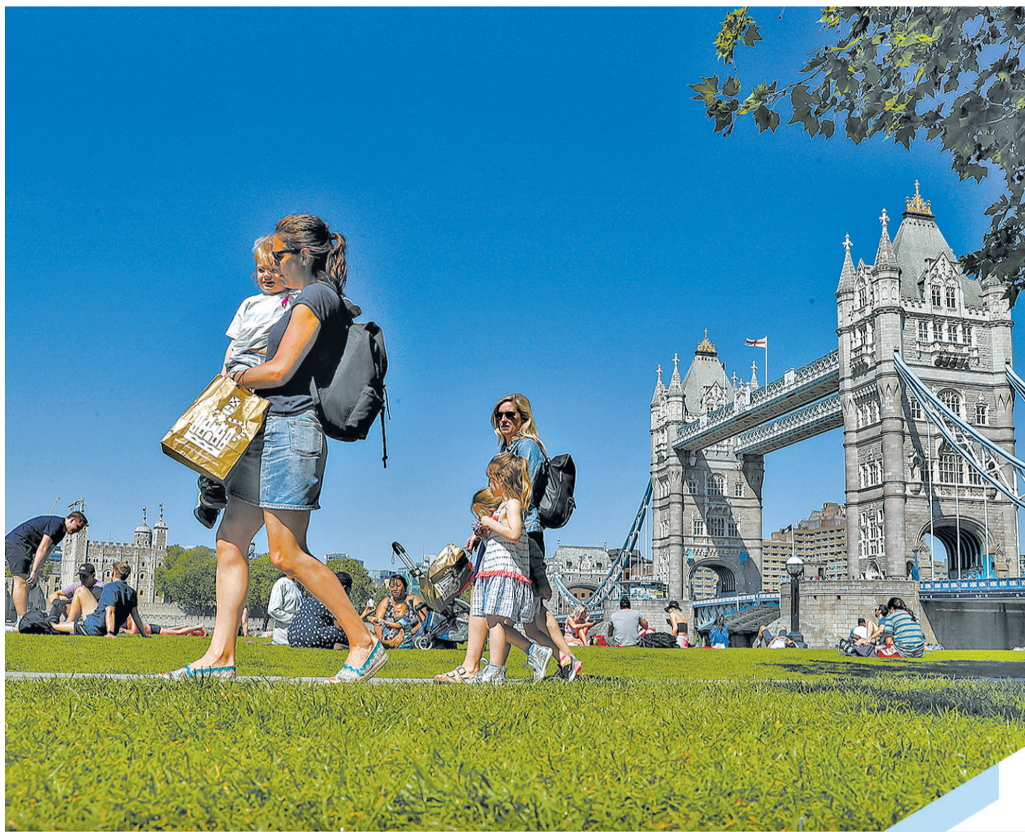
人们从英国伦敦泰晤士河南岸的草坪上走过。