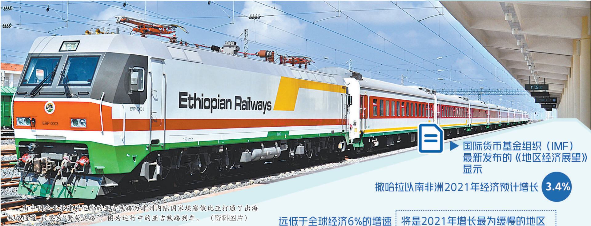
由中国企业承建运营的亚吉铁路为非洲内陆国家埃塞俄比亚打通了出海铁路通道，被誉为“繁荣之路”。图为运行中的亚吉铁路列车。（资料图片）

5月25日是“非洲日”。58年前，在泛非主义旗帜引领下，非洲统一组织应运而生，开启了非洲联合自强、发展振兴的进程。近年来，非洲集体影响力显著提升，在国际事务中发挥越来越重要的作用。 突如其来的新冠肺炎疫情给非洲经济社会发展带来严峻挑战。种种迹象表明，非洲疫情应对和经济恢复能力相对较弱，疫后重建面临诸多困难。 面对国际变局，中非双方主持公道，相互支持。作为联合国安理会5月轮值主席，在中国倡议下，安理会日前举行“非洲和平与安全：推进非洲疫后重建，消除冲突根源”高级别会议，中非共同发起“支持非洲发展伙伴倡议”，重点阐述了对非洲发展的基本立场、原则和主张，呼吁国际社会在抗击疫情、疫后重建、贸易投资、债务减免等领域加大对非洲的支持力度，汇聚支持非洲发展的强大合力。