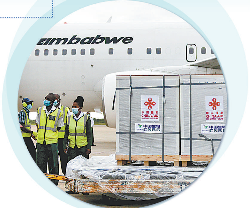
2月15日，工作人员在津巴布韦首都哈拉雷的罗伯特·穆加贝机场卸载中国政府援助的新冠疫苗。