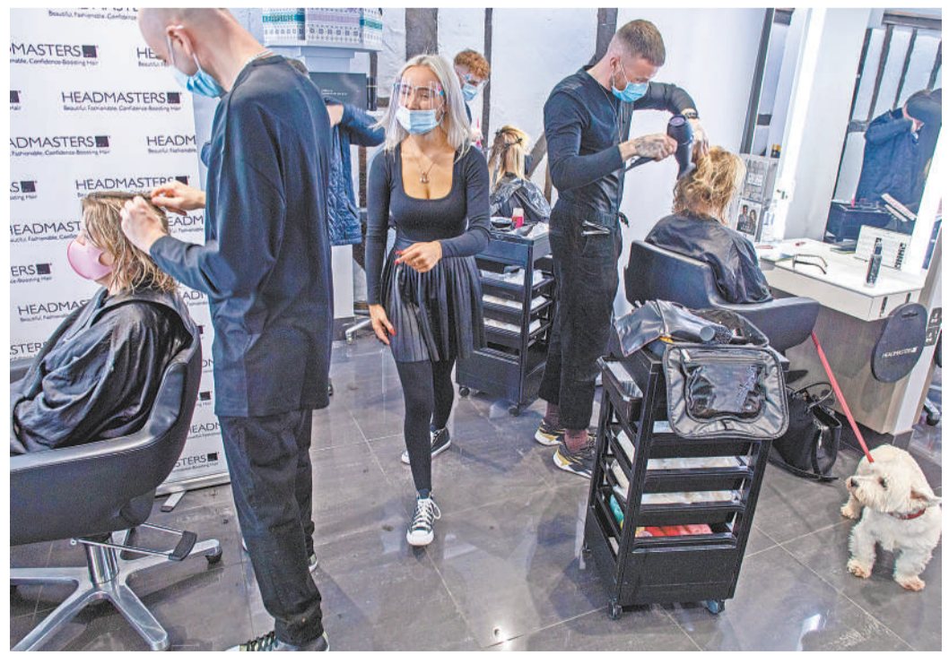
这是4月12日在英国温莎拍摄的一家美发厅。当日起,英国英格兰地区进一步放宽为防控新冠肺炎疫情而实施的封城措施。

不过,英国经济复苏前景仍存在不确定性。比如,随着经济活动的复苏,闲置资源被集中利