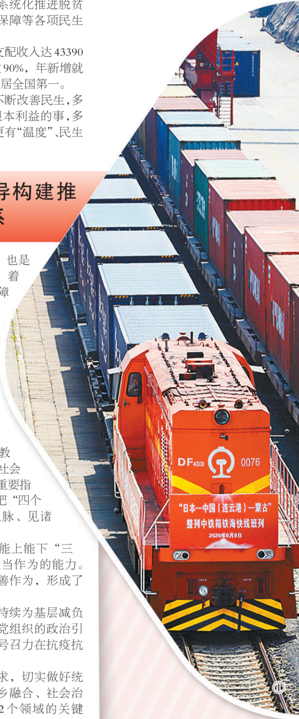
图① 2020年6月8日，“日本—中国（连云港）—蒙古”整列中铁箱铁海快线班列从连云港中哈物流基地首发。