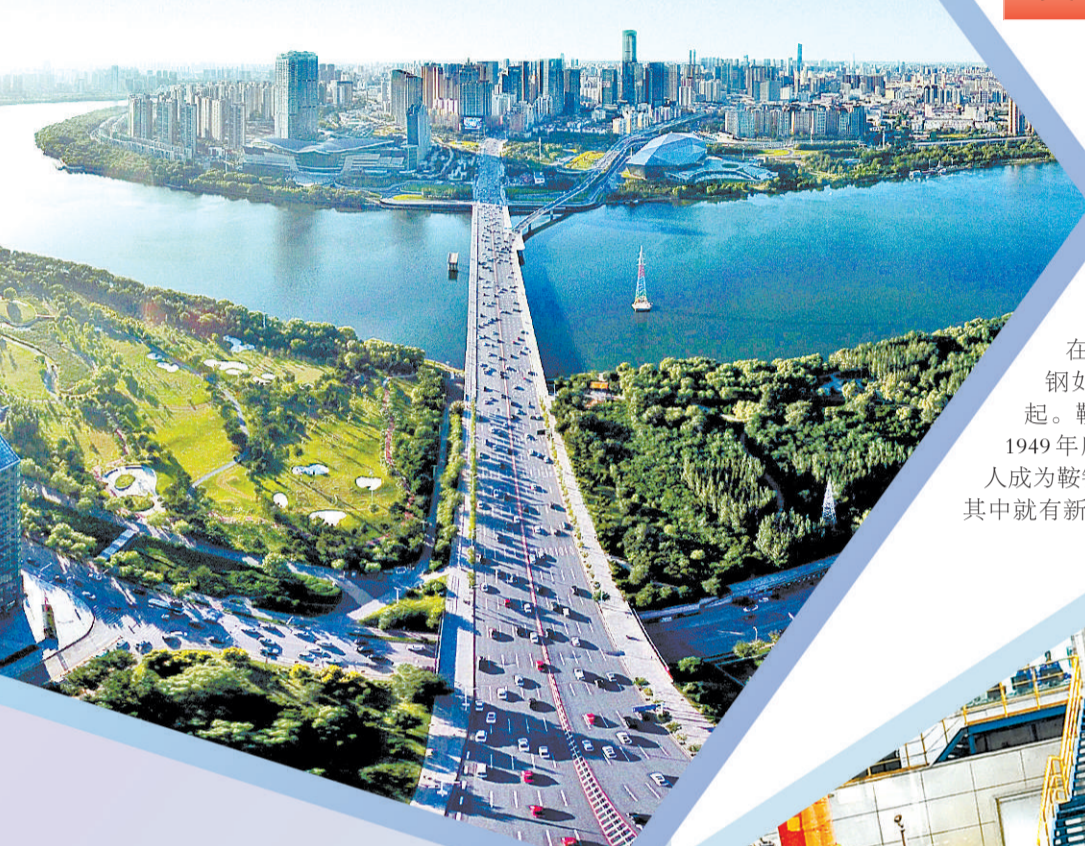
上图 让绿色成为城市发展底色，沈阳迈向国家先进制造业中心的同时也把城市铺展得更加美丽。