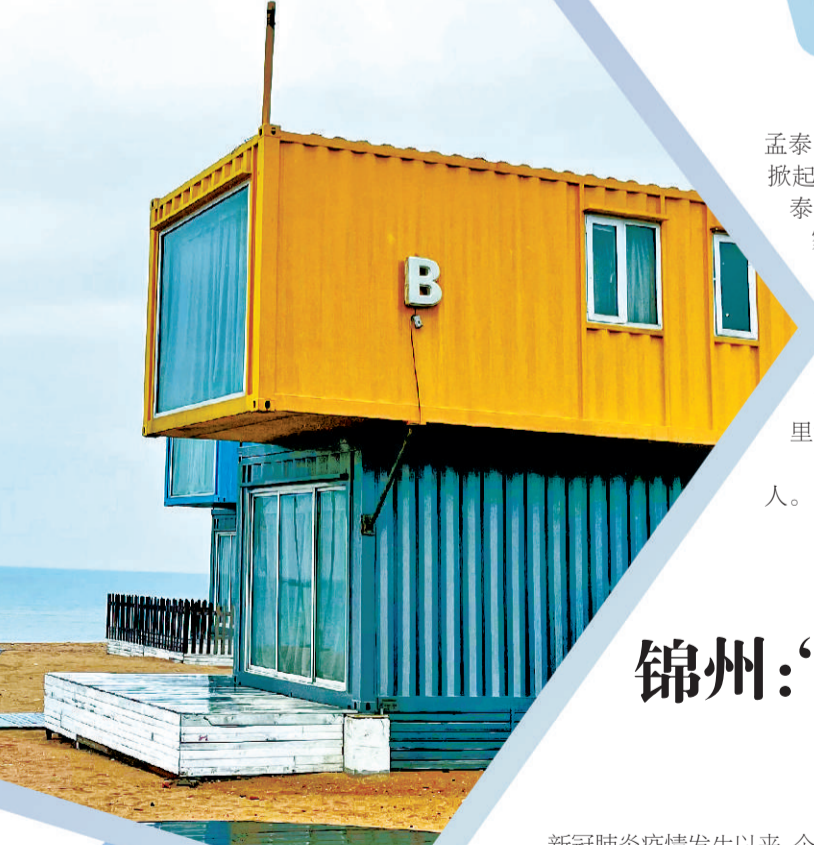
绥中县东戴河网红景点“集装箱概念酒店”。