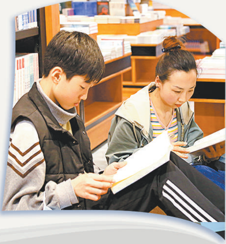
4月20日，湖北省恩施市城区的图书馆内，市民们正在读书以感受阅读的魅力。

深入推进全民阅读，建设“书香中国”，已被写入“十四五”规划和2035年远景目标纲要。希望更多出版企业展现一番作为，为建设“书香中国”作出应有贡献。我们也期待，图书市场上涌现出更多有品质、有影响力、有传播力的精品佳作，让中国好书展现出无愧于时代、无愧于人民、无愧于未来的风采。