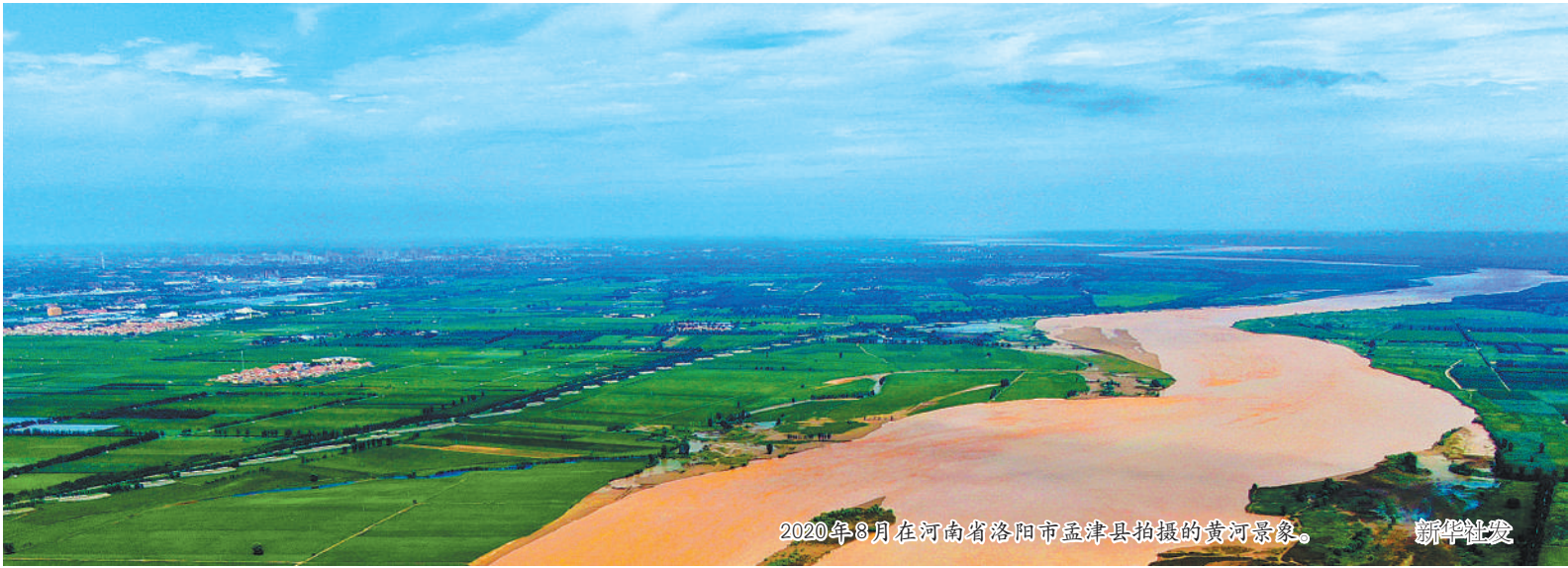
2020年8月在河南省洛阳市孟津县拍摄的黄河景象。

由于气候的阶段性变化，大水漫灌下的农业用水，又造成地下水的超采，也造成华北平原的超级大漏斗，四女寺水利工程枢纽预想的航运功能，缺少用武之地，运河活力也有所大减。但近年来，在黄河流域水土保持的同时，与黄河关系密切的北方运河城市，也开始了“宜航则航、宜游则游”的多种努力，从河阳一路走来的卫运河，也面临新一轮机会。