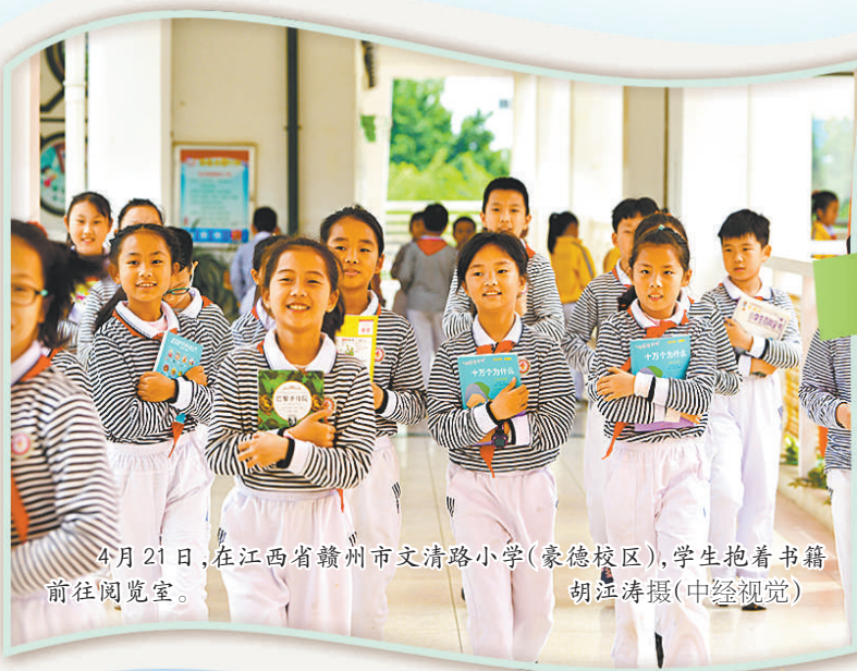
4月21日，在江西省赣州市市文清路小学（豪德校区），学生抱着书籍前往阅览室。