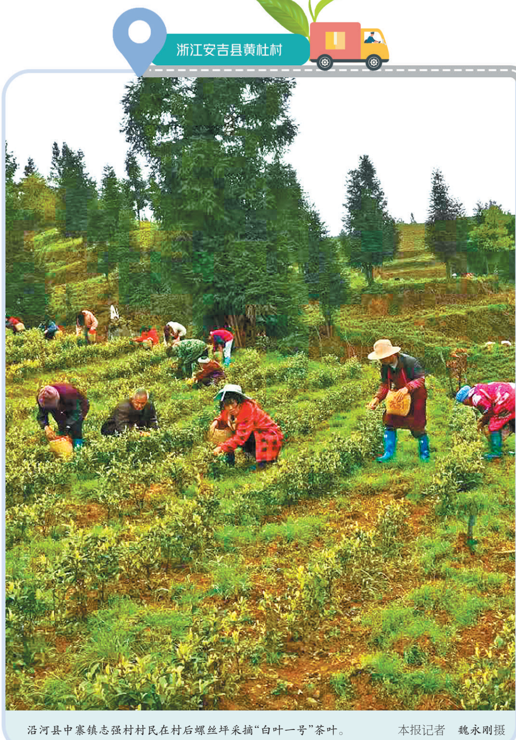
沿河县中寨镇志强村村民在村后螺丝坪采摘“白叶一号”茶叶。