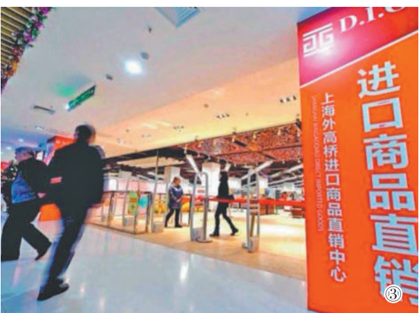
图① 滴水湖畔的上海自贸试验区临港新片区。 图② 上海自贸试验区陆家嘴片区。 图③ 上海自贸试验区外高桥保税区内上海外高桥进口商品直销中心。