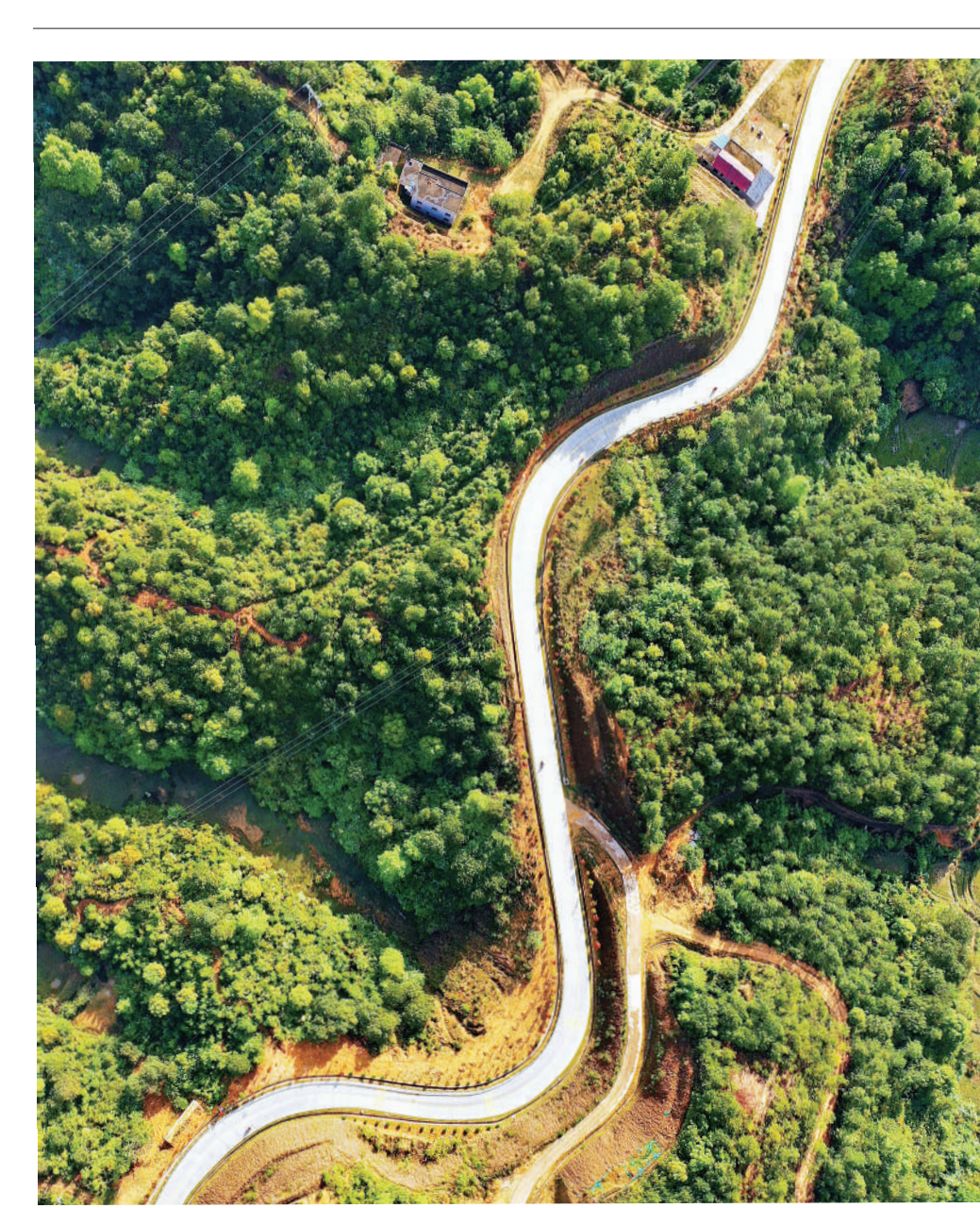
4月4日,车辆行驶在江西省会昌县文武坝镇林富村会河线乡村公路。近年来,当地以“四好农村路”建设为抓手,构建起完善便捷的农村公路网络,带动了脐橙、茶叶、小南瓜等特色农产品运出深山销往各地,为乡村振兴提供了交通基础。