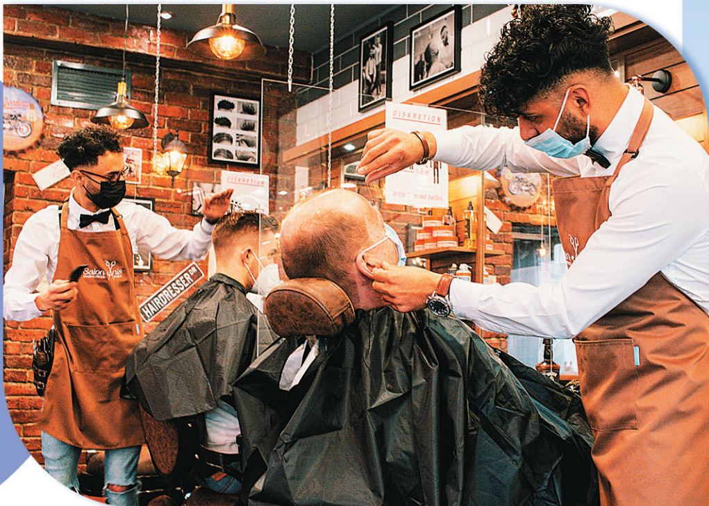
3月1日,理发师在德国科隆的一家理发店为顾客服务。

虽然短时工作制度带来了一定的工资损失,但最大限度地保障了员工的基本收入和就业安全,有助于企业和员工度过危机。同时,在危机期间保持工资水平不出现大幅下滑,一定程度上稳定了德国国内购买力,是稳定内需的有力支撑,进而促进经济复苏。对于德国政府而言,短时工作制度确保就业基本稳定,有利于维持基本的经济和社会秩序,并在危机结束后迅速恢复正常状态。