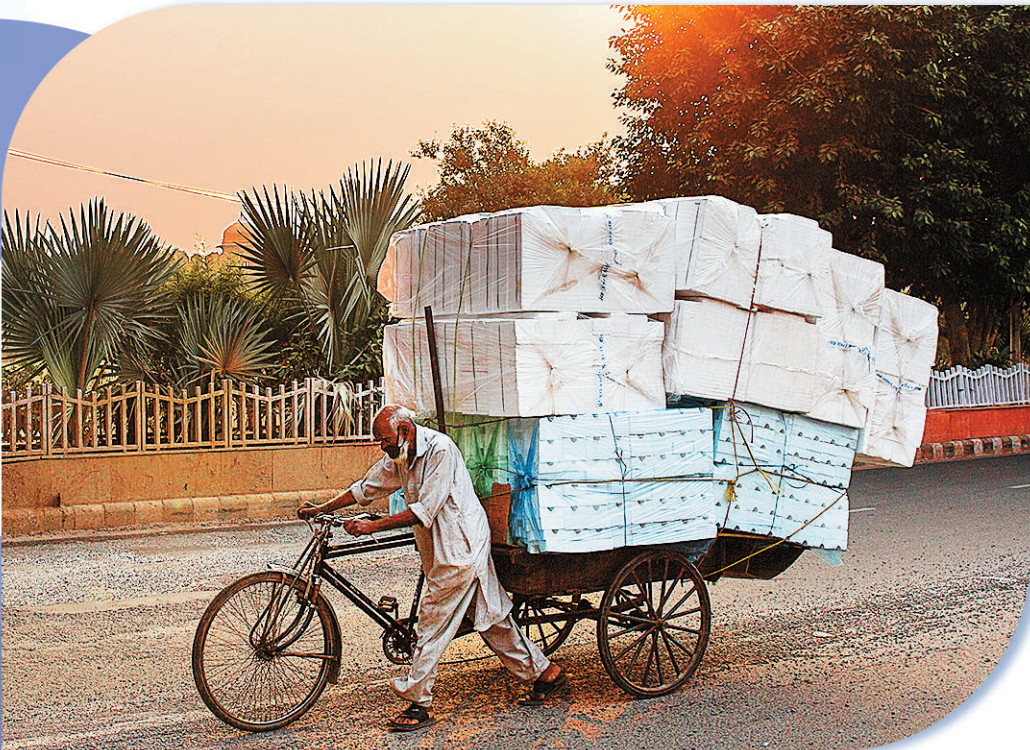
在印度新德里,一名男子推着装满货物的三轮车前行。