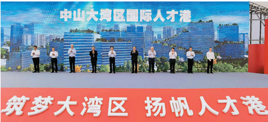
3月29日,中山大湾区国际人才港正式启动建设。