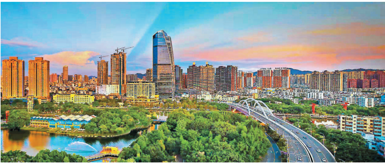
中山市岐江两岸美不胜收