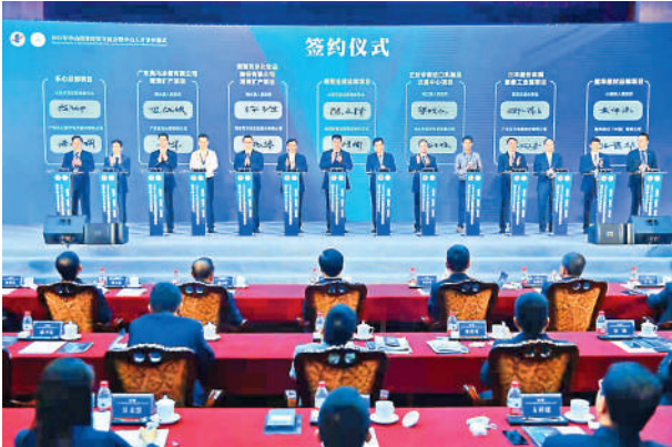
3月28日,2021年中山投资经贸交流会暨中山人才节开幕。