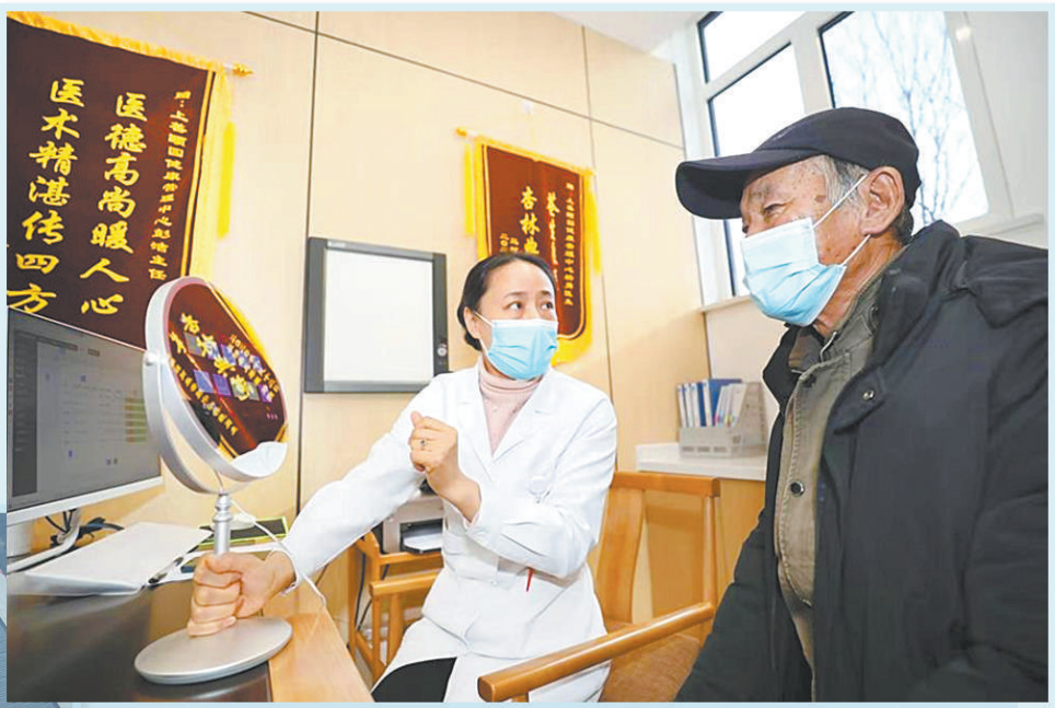
上图 廊坊市广阳区上善怡园社区医务工作者为居民进行免费健康咨询。