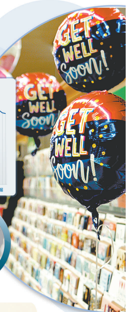
3月6日,在美国加利福尼亚州米尔布雷一家商店,印有“快好起来”字样的气球悬挂在礼品卡货架上。

目前,外国投资者仍是美国国债的最大持有者,但他们的购买步伐在2020年明显放缓,总体市场份额从35%降至不到30%,这意味着美国印钞满足自身要求、成本由外国承担的局面正在发生变化。毕竟,伴随着10年期美债收益率飙升的,是比特币价格一度突破60000美元。