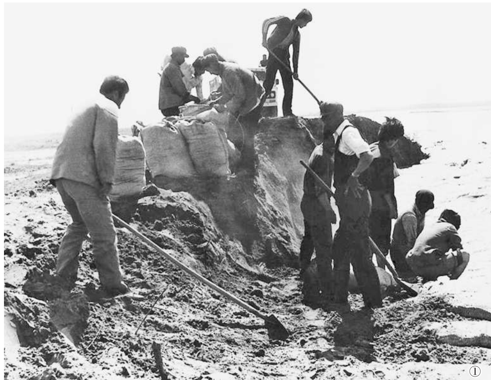
图① 1988年，一八五团抗洪抢险现场。 图② 一八五团抗洪守土纪念碑。 图③ 一八五团白沙湖景区一角，这是兵团首个5A级景区。 (资料图片)

品牌，大力推介“西北边境第一连”“西北之北”“白沙湖”等旅游景点。2019年，全团接待游客25万人次，实现旅游收入5208万元，带动近千人就业。去年受新冠肺炎疫情影响，旅游业发展放缓，该团通过加强人员培训、改善基础设施等提升“内功”，为今后发展蓄力。