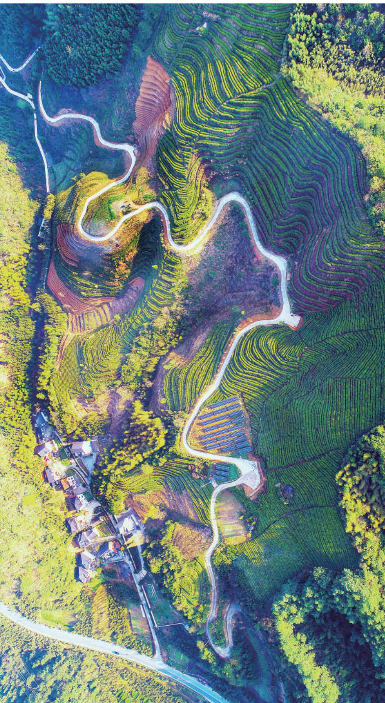
3月23日，浙江省杭州市临安区闲坞村，茶山与农房相映成景。近年来，当地将美丽乡村建设与发展乡村旅游、特色产业相结合，使乡村更加绿色宜居。