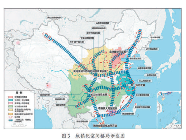
图3 城镇化空间格局示意图

加快县城补短板强弱项,推进公共服务、环境卫生、市政公用、产业配套等设施提级扩能,增强综合承载能力和治理能力。支持东部地区基础较好的县城建设,重点支持中西部和东北城镇化地区县城建设,合理支持农产品主产区、重点生态功能区县城建设。健全县城建设投融资机制,更好发挥财政性资金作用,引导金融资本和社会资本加大投入力度。稳步有序推动符合条件的县和镇区常住人口 20 万以上的特大型设市。按照区位条件、资源禀赋和发展基础,因地制宜发展小城镇,促进特色小镇规范健康发展。