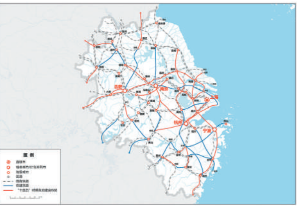
图6 长三角地区轨道交通规划图

瞄准国际先进科创能力和产业体系,加快建设长三角 G60 科创走廊和沿沪宁产业创新带,提高长三角地区配置全球资源能力和辐射带动全国发展能力。加快基础设施互联互通,实现长三角地级及以上城市高铁全覆盖,推进港口群一体化治理。打造虹桥国际开放枢纽,强化上海自贸试验区临港新片区开放型经济集聚功能,深化沪苏浙皖自贸试验区联动发展。加快公共服务便利共享,优化优质教育和医疗卫生资源布局。推进生态环境共保联治,高水平建设长三角生态绿色一体化发展示范区。