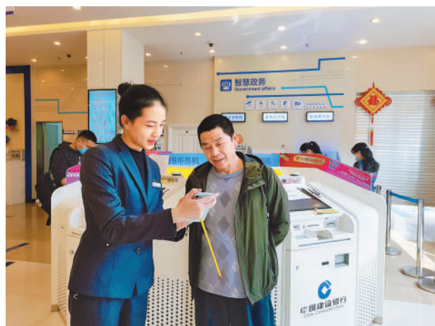
建设银行员工指导客户领取留岗红包