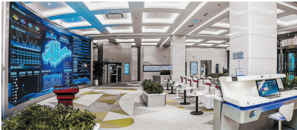
建设银行山东济南泉城支行智慧政务大厅

三是安全优势。随着互联网的全面普及，网络诈骗的方式呈逐年上升趋势。据《2020年上半年互联网网络安全监测数据分析报告》显示，2020年上半年捕获计算机恶意程序样本达到1815万次。