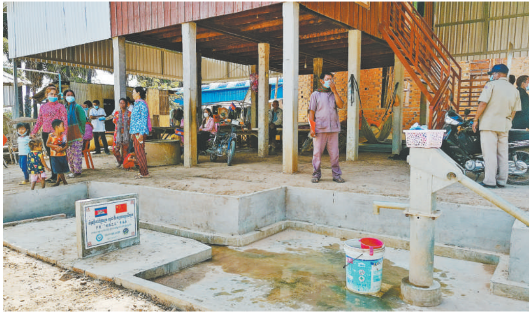
中国和平发展基金会在柬埔寨茶胶省巴提县达弄村挖的乡村水井。