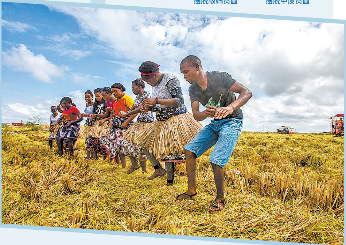
万宝莫桑农业园是中国在非洲最大规模水稻种植项目，极大地缓解了莫桑比克粮食短缺问题。在莫桑比克万宝莫桑农业园，农户在水稻收割现场载歌载舞庆祝丰收。

根据世界银行研究报告 “一带一路”倡议将使相关国家 约760万人摆脱极端贫困 3200万人摆脱中度贫困