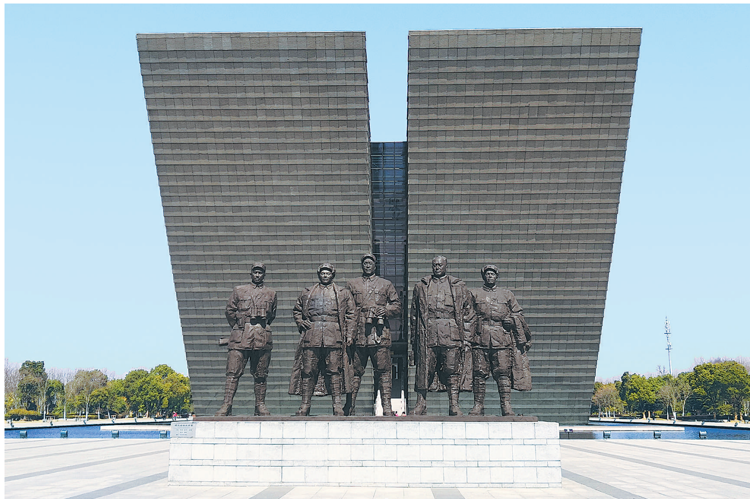
渡江战役纪念馆前伫立着渡江战役5名总前委的雕塑，从左到右依次为粟裕、邓小平、刘伯承、陈毅、谭震林。