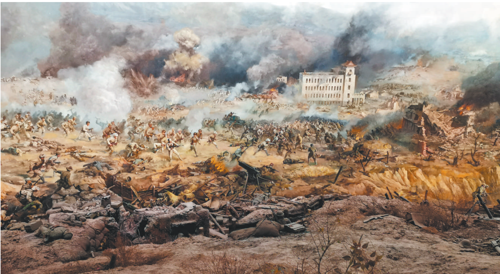
辽沈战役全景图(局部)。

战场上,牺牲的将士已成为我们心中的丰碑。英雄,是民族的脊梁,是时代的先锋。崇尚英雄、学习英雄、争当英雄,理应成为新时代的崇高理想。