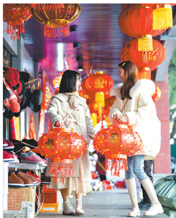
1月29日，江西庐山市农贸市场，各种节庆商品琳琅满目，两位年轻人正在采购年货。