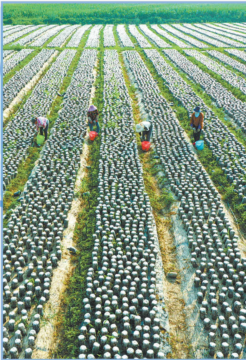
河北赤城县样田乡双山寨村食用菌种植基地。

目前，赤城全县上下正以“风物长宜放眼量”的格局，“初心坚如磐”的信念，“击鼓催征马蹄疾”的气魄，全面巩固脱贫攻坚成果，不断增强人民群众获得感、幸福感、安全感。