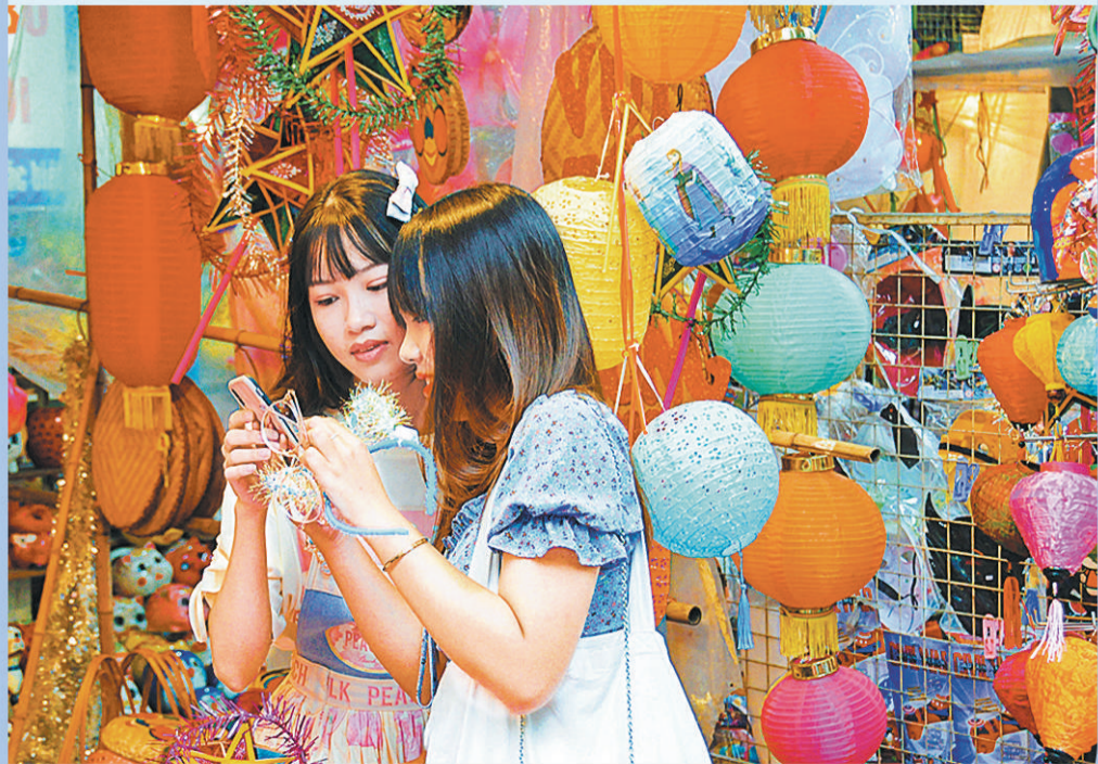
图为女青年在越南首都河内古街区的节日礼品店前拍照。

如新冠疫苗发挥作用,世界疫情得到控制,2021年越南经济增速有望达到 6.8% 并在后续几年保持6.5%的增长水平