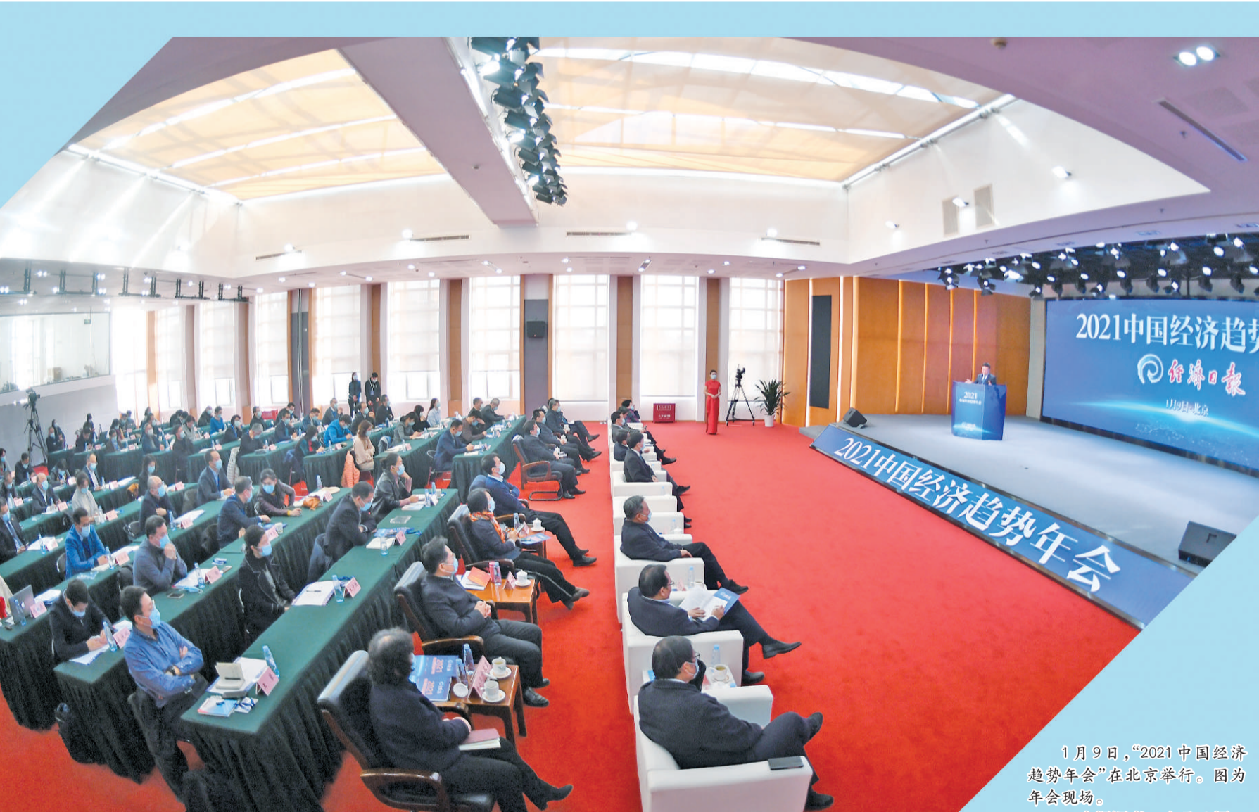
1月9日,“2021中国经济趋势年会”在北京举行。图为年会现场。

受疫情影响,2020年一季度GDP同比下降6.8%,二季度增长3.2%,三季度增长4.9%,经济增速逐季回升。随着复工复产的推进,就业形势持续向好,11月份全国城镇调查失业率为5.2%。物价形势总体可控,整体呈现“前高后低”态势,全年CPI指数将控制在3%的预期目标之内。盛来运表示,国际收支更是好于预