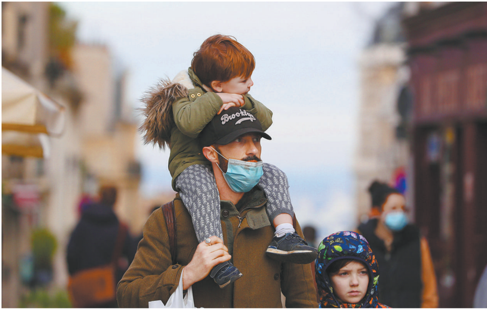
2021年1月1日,一对父子来到法国巴黎蒙马特高地迎接新年第一天。

2020年,法国经济可谓风雨飘摇,一波三折。突如其来的新冠肺炎疫情使原已步入稳定复苏区间的法国经济遭受了二战后最严重的打击,市场表现持续黯淡,前期结构性改革红利消耗殆尽。