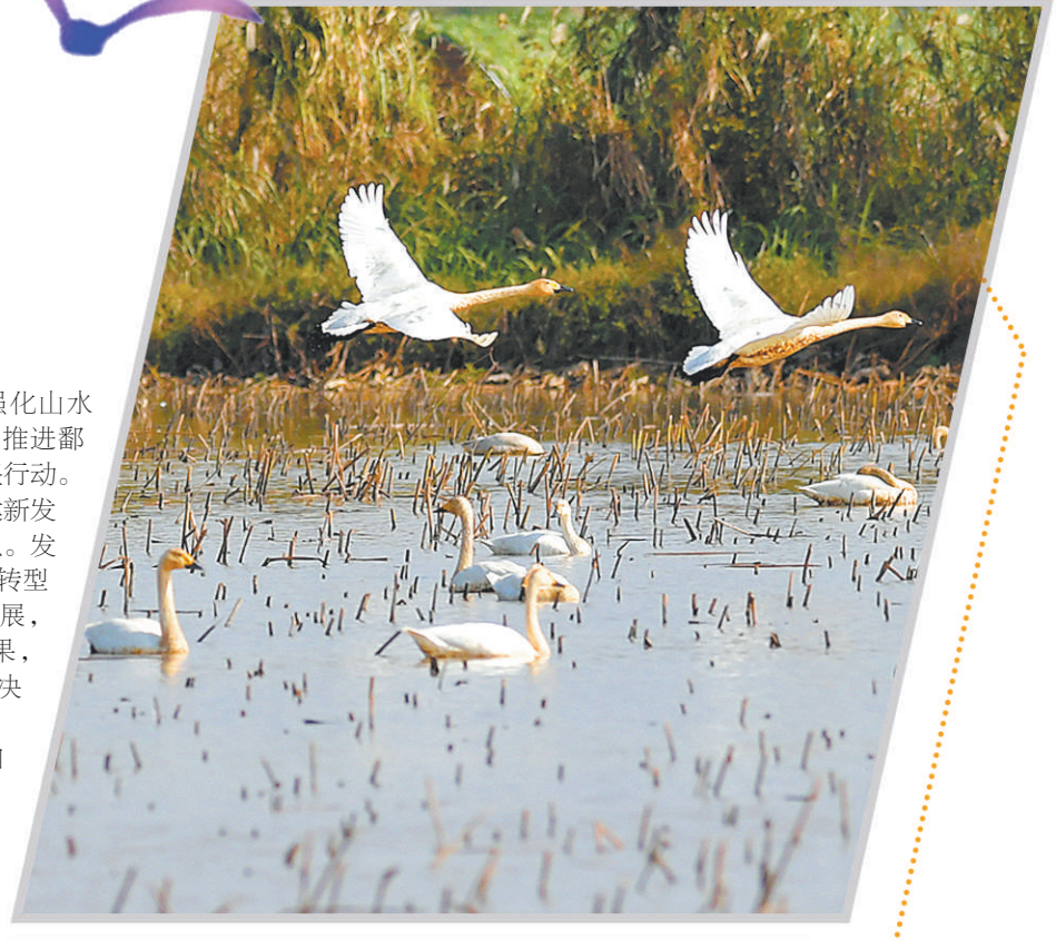
在江西南昌高新区鲤鱼洲管理处周边水域,越冬候鸟栖息于此(2020年11月5日摄)。

狠抓突出问题整改,强化山林田湖草生命共同体,推进鄱阳湖流域保护修复攻坚行动。 更加注重打造构建新发展格局的重要战略支点。发挥比较优势,推动企业转型升级,促进优势产业发展,巩固提升脱贫攻坚成果,全面推进乡村振兴,坚决扛稳粮食安全责任。 更加注重提升双向开放能级。高标准建设内陆开放型经济试验区,积极融入共建“一带一路”、长江经济带和长三角一体化,协同推进长江中游城市群建设。 更加注重产业基础高级化、产业链现代化。坚持把经济发展的着力点放在实体经济上,拉长长板,补齐短板,加快推进创新型省份建设,不断壮大先进制造业集群。 更加注重传承弘扬长江文化。加强文物古迹保护、研究、利用,挖掘城市文化底蕴,发掘、提炼、整合赣鄱文化资源,提升文化内涵,发展现代文化产业,着力绘就山水人城和谐相融美丽长江画卷的赣鄱篇章。