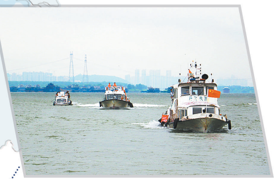
湖南在长江流域开展非法捕捞高发水域巡查执法。图为2020年8月10日在湖南长沙拍摄的巡查执法现场。