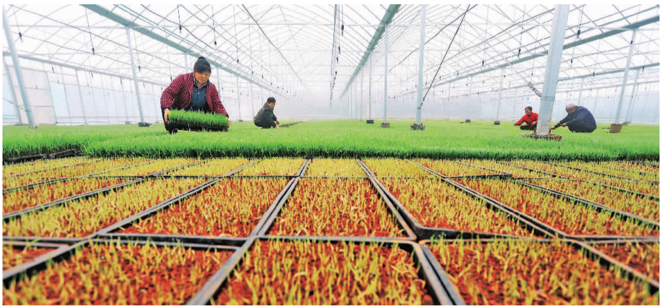
3月21日,江西省安福县瓜畲乡田东村“育秧工厂”内,技术人员和工人在管理水稻秧苗。今年,当地大力建设高标准农田,全面推行机耕、机育、机插等,为稳产高产打下坚实基础。

上海市文明办副主任郑英豪表示,下一步将加大志愿者招募培训力度,公布“上海志愿者”网站和微信小程序招募疫情防控志愿者的渠道,提升市民的知晓度和参与度。同时,做好志愿者保障激励工作。上海市志愿者协会已协调中国人寿保险股份有限公司上海分公司,为疫情防控志愿者免费提供“守护志愿者”特定保险。志愿者还可在申领“上海市新冠肺炎疫情防控工作志愿服务证书”。在物资保障上,将更加及时回应基层诉求,把物资第一时间发给一线志愿者。广泛宣传疫情防控志愿者的暖心感人故事,让志愿者精神深入人心。