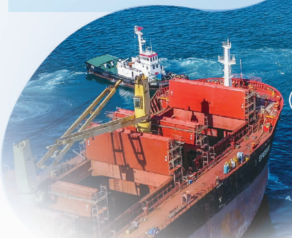
希腊比雷埃夫斯港口的修造船区域。(资料图片)

希腊财政部数据显示,2020年底希腊政府公共债务存量高达3740亿欧元,债务水平占国内生产总值的比重超200%,仍是欧盟第一大债务国。尽管希腊将完全偿还IMF的救助贷款,但相比希腊庞大的债务存量,IMF的贷款就显得“杯水车薪”。希腊政府为应对疫情而采取的经济刺激和财政帮扶措施导致政府开支大幅增加,如何确保债务总体规模稳步下降和可持续也成为希腊政府需要长期面临的挑战。幸运的是,希腊公共债务结构相对单一稳定,偿债期限较为宽松,且偿债成本较低。在2020年底存量3740亿欧元的公共