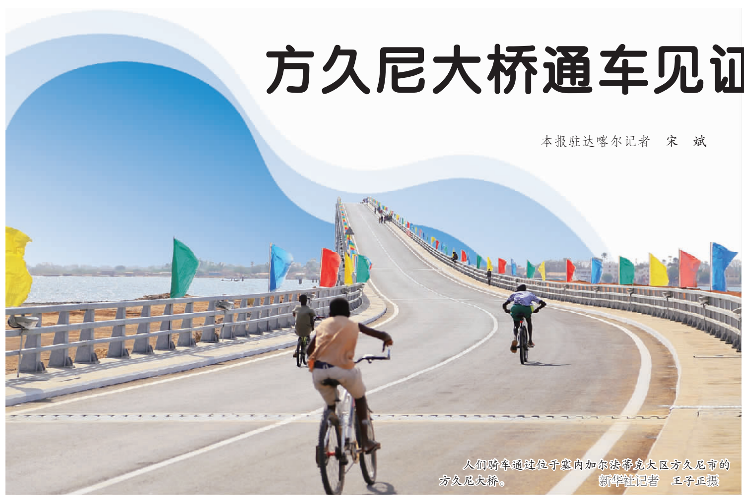
人们骑车通过位于塞内加尔法蒂马大区方久尼市的方久尼大桥。