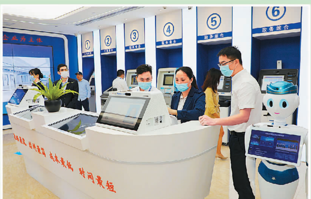
广州市黄埔区政务服务科学城智慧分中心。