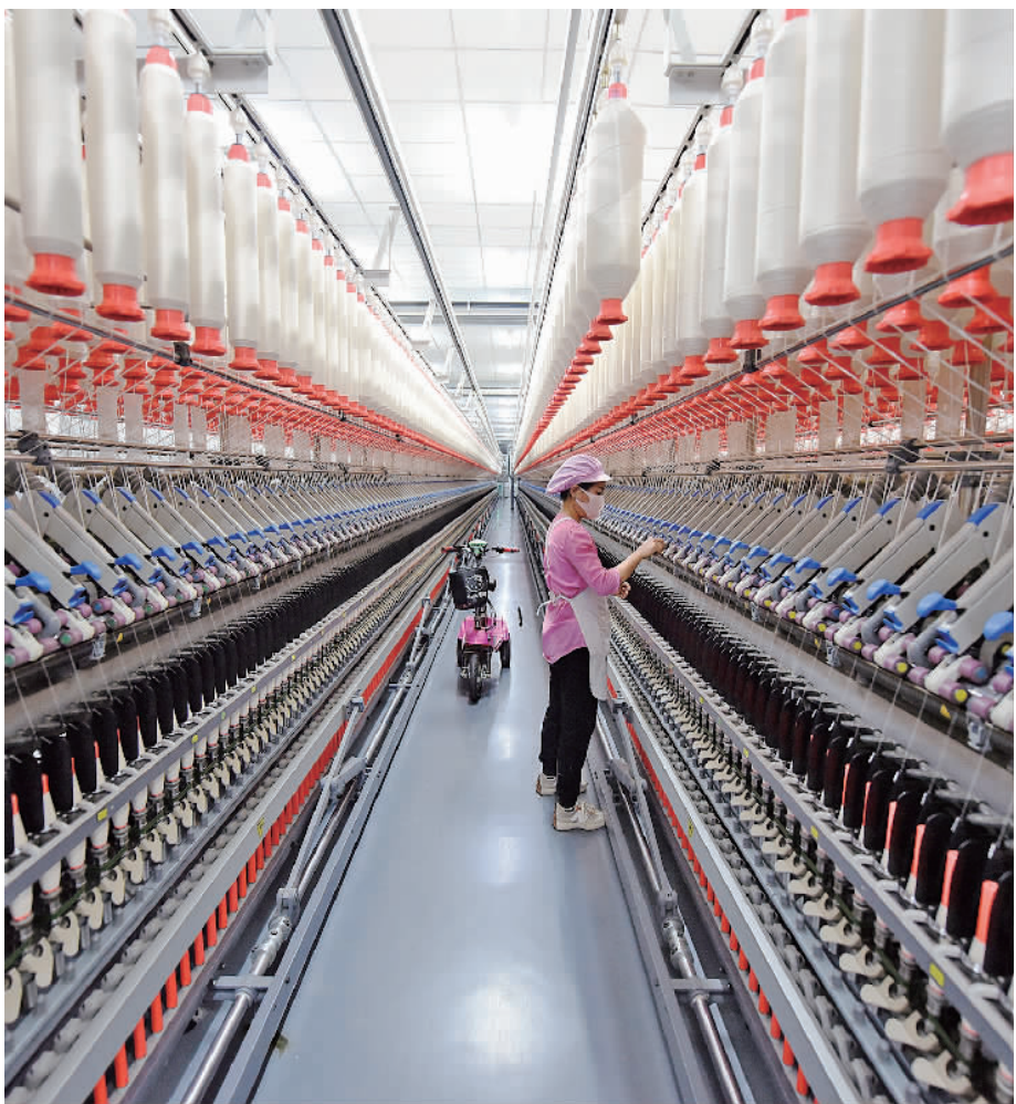
2月18日,山东临沂市郯城县李庄镇一家纺纱企业的工人在生产线上作业。近年来,郯城县大力推动产业智能化、绿色化、高端化,不断培育壮大新兴产业,推动传统产业转型升级,持续释放发展潜能。目前,该县科技创新型企业已有76家。

在此次《实施方案》中,《依托广州开发区进一步加大改革力度探索更多有益经验的工作举措清单》专章令人关注,其提出了