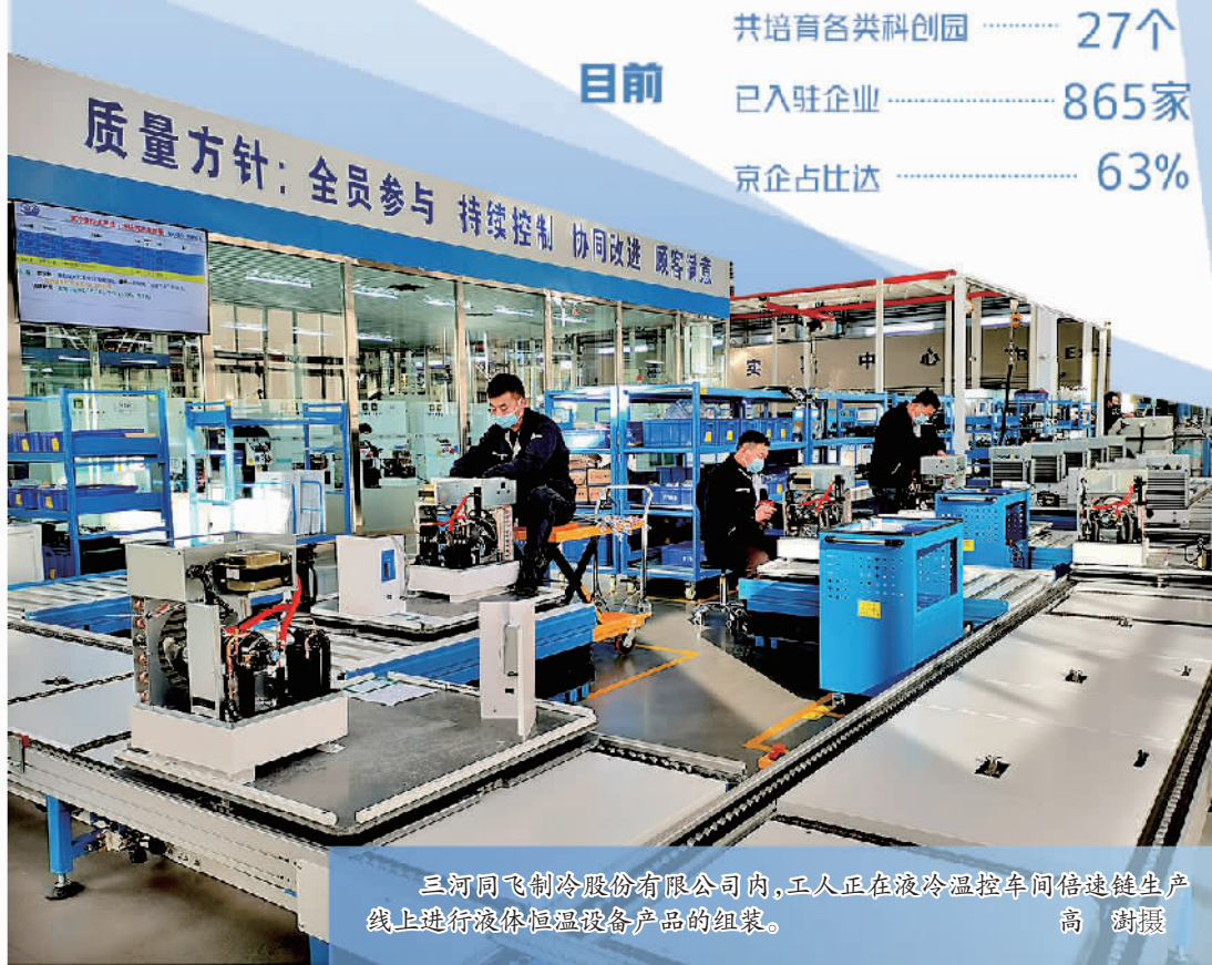
三河同飞制冷股份有限公司内,工人正在液冷温控车间倍速生产线上进行液冷温控设备产品的组装。

据了解,2021年,三河市办理并联审批事项565个,并联率80.26%。其中,社会投资备案类项目从立项备案到施工许可,纯部门审批时间最短4天