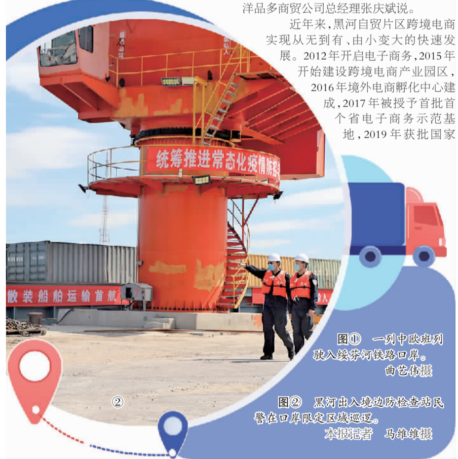
图① 一列中欧班列驶入绥芬河铁路口岸。