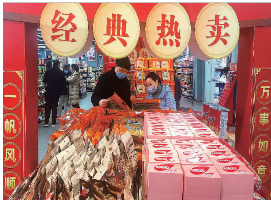
◀2月4日,顾客在江西省南昌市朝阳洲天虹购物中心选购节日食品。春节假日,当地推出各类优惠折扣、美食套餐等供顾客选购。