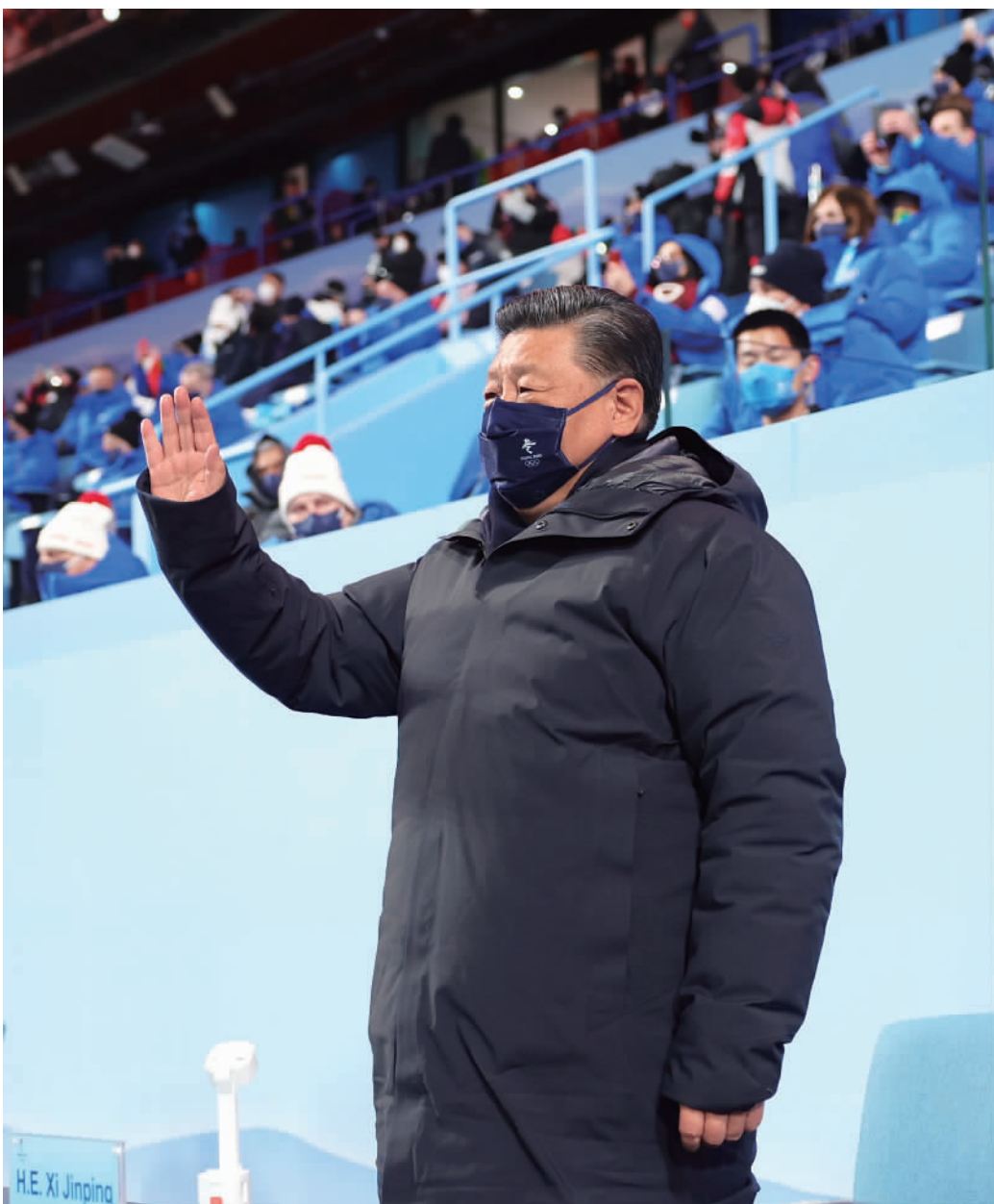
2月4日晚,北京第二十四届冬季奥林匹克运动会开幕式在国家体育场隆重举行。这是国家主席习近平在主席台上向大家挥手致意。

李克强栗战书汪洋王沪宁赵乐际韩正王岐山 国际奥委会主席巴赫 来自世界各地的领导人和贵宾等出席