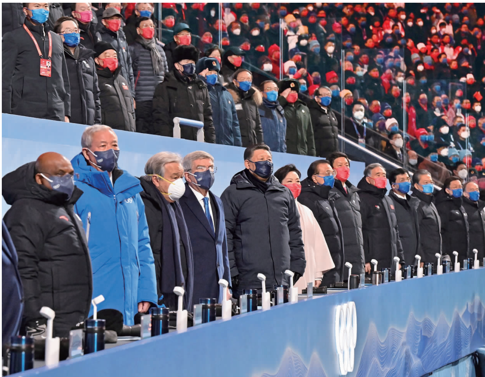
2月4日晚,北京第二十四届冬季奥林匹克运动会开幕式在国家体育场隆重举行。习近平、李克强、栗战书、汪洋、王沪宁、赵乐际、韩正、王岐山等党和国家领导人出席开幕式。

新华社北京2月4日电 筑梦冰雪,同向未来。2022年2月4日晚,举世瞩目的北京第二十四届冬季奥林匹克运动会开幕式在国家体育场隆重举行。国家主席习近平出席开幕式并宣布本届冬奥会开幕。中华文明与奥林匹克运动再度携手,奏响全人类团结、和平、友谊的华美乐章。