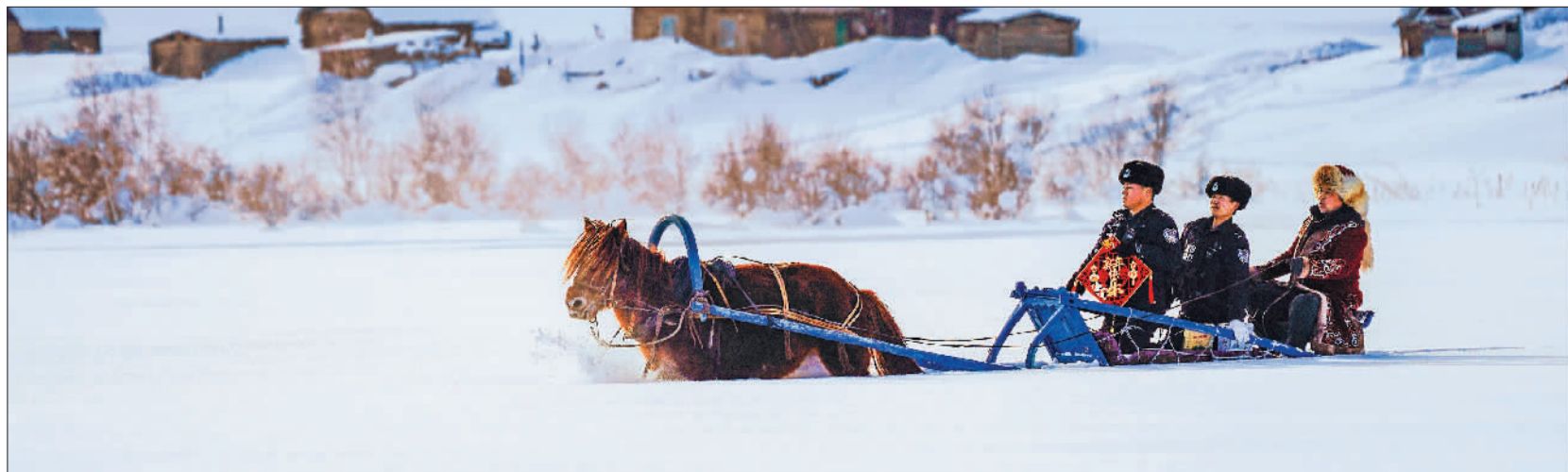
▼1月27日,新疆出入境边防检查总站阿勒泰边境管理支队喀纳斯大队禾木边境派出所,民警和护边员正搭乘“爬犁警车”走访慰问送祝福。