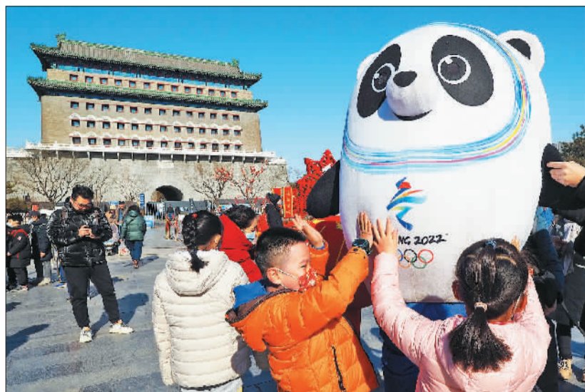
▲1月29日,北京前门大街,北京冬奥会和冬残奥会吉祥物“冰墩墩”和“雪容融”卡通人偶深受孩子们喜爱。