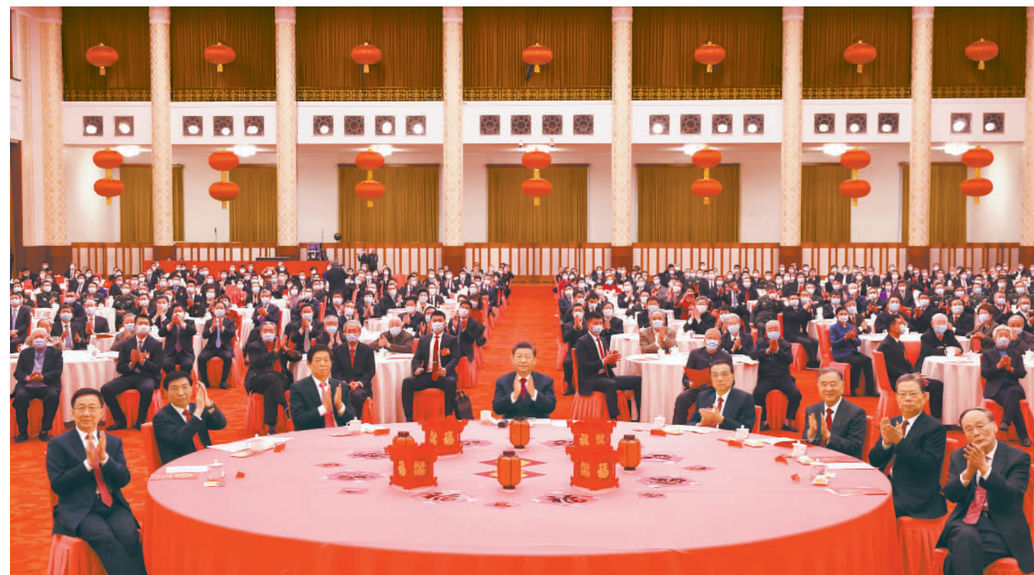
1月30日,中共中央、国务院在北京人民大会堂举行2022年春节团拜会。中共中央总书记、国家主席、中央军委主席习近平发表讲话。