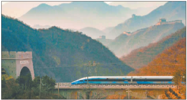
▼2022年1月7日,身披“瑞雪迎春”涂装的北京冬奥列车行驶在京张高铁线上。