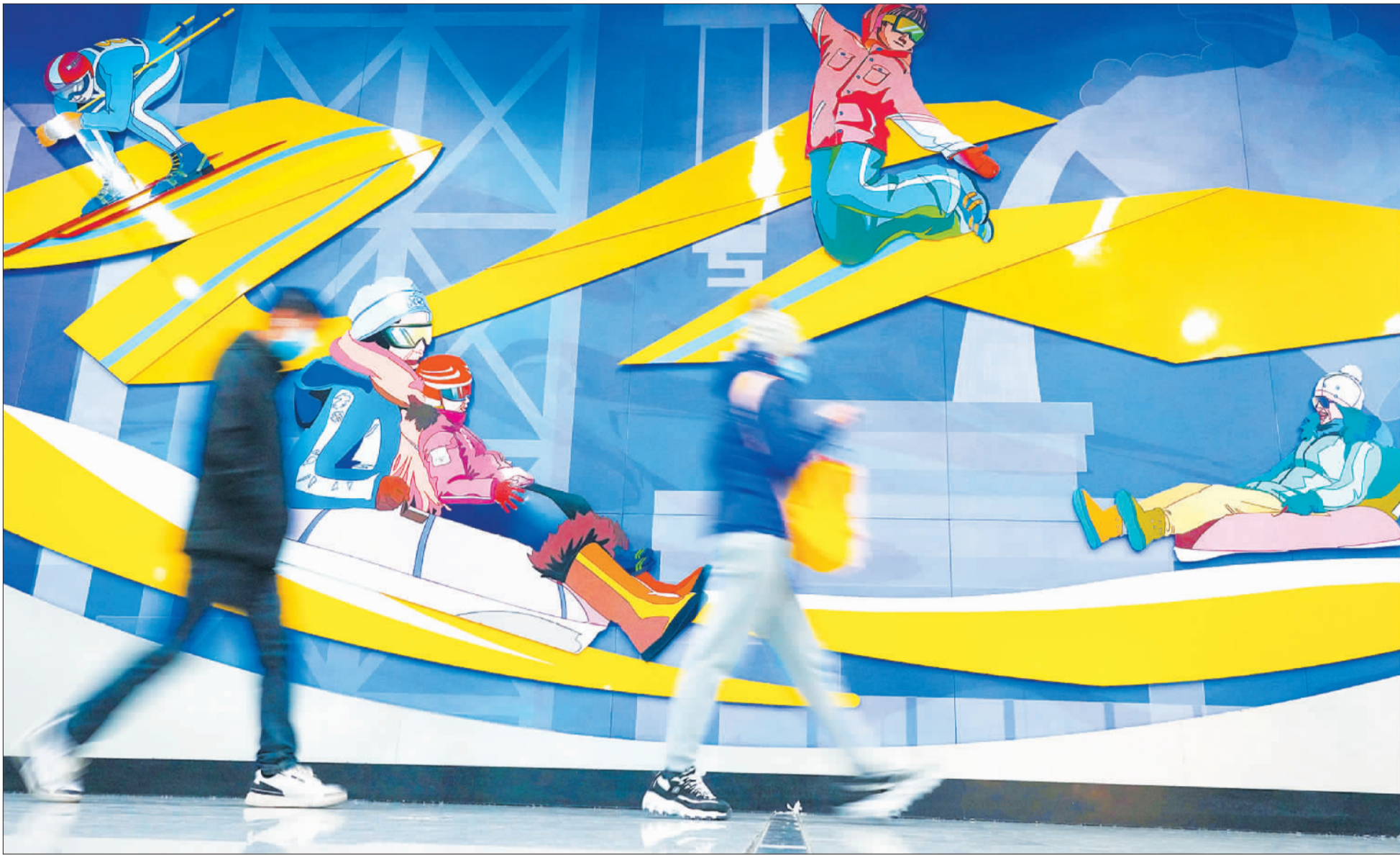
▲2022年1月11日,乘客从北京地铁金安桥站站厅走过。随着冬奥会的临近,北京多条地铁线路的装饰设计融入冰雪元素,营造出浓厚的冬奥氛围。