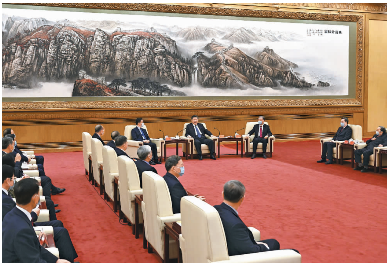
1月29日,习近平、汪洋、韩正等在北京人民大会堂同党外人士欢聚一堂,共迎佳节。

习近平指出,过去的一年是多党合作事业取得丰硕成果的一年。各民主党派、工商联和无党派人士贯彻中共中央决