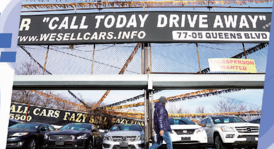
1月12日,行人从美国纽约一家二手车行外走过。

报告指出,在未来两年乃至以后,就业状况预计仍将远低于疫情暴发前水平。美国和欧洲的劳动力参与率仍徘徊在历史低位,因为许多在疫情期间失业或离开劳动力市场的人员尚未返工。发达经济体的劳动力短缺,导致供应链挑战增加,通胀压力加剧。同时,由于疫苗接种进展缓慢,刺激支出有限,发展中国家就