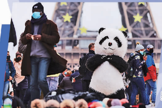
在法国巴黎埃菲尔铁塔附近的特罗卡德罗广场,一名小贩打扮成大熊猫玩偶的模样招揽顾客。