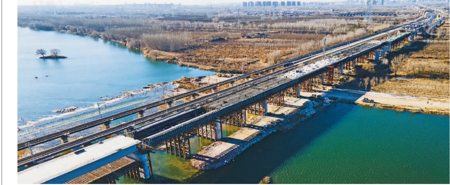
12月17日，中铁六局承建的京唐城际铁路北京段首个连续梁合龙，为后续箱梁架设和铺轨打下坚实基础。京唐城际铁路是京津冀城际铁路网规划中“四纵四横一环”的重要组成部分，开通后将打通北京至唐山城际铁路通道，推动京津冀地区经济协同发展。

在“群众说事 干部解题”工作机制建设过程中，廊坊涌现出以广阳区新源街道为代表的“微信公众号+网格化治理平台”模式，以安次区调头乡为代表的“微信公众号+大喇叭”模式和以霸州市裕华街道为代表的“街道综治中心+楼门长、街组长”等多种模式。