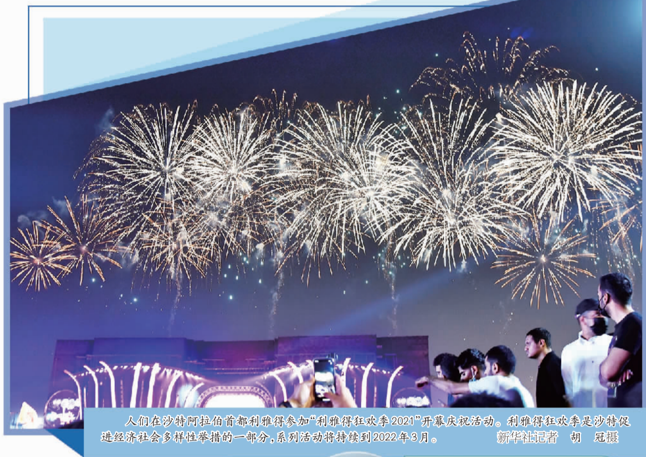
人们在沙特阿拉伯首都利雅得参加“利雅得狂欢季2021”开幕庆祝活动。利雅得狂欢季是沙特促进经济社会多样性举措的一部分，系列活动将持续到2022年3月。

部门发展计划(FSDP)和私有化计划等,旨在为私营部门赋能,在减少公共支出压力的同时增加非石油收入。