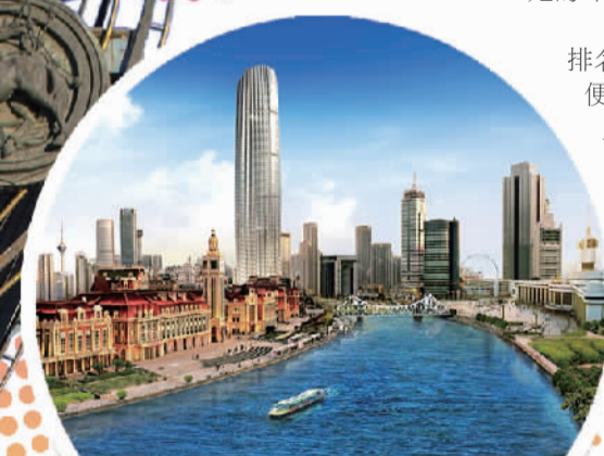
天津地标商圈之一的天津津湾广场。(资料图片)