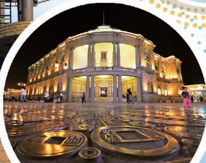
天津市金街商圈的星巴克臻选旗舰店。