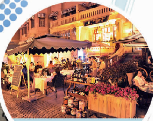
游客在天津河北区意式风情区内喝啤酒。