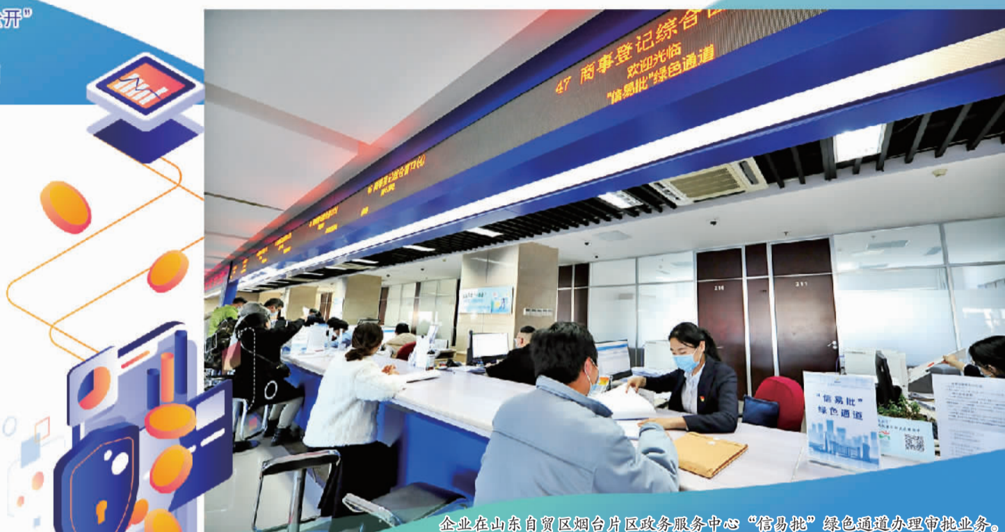
企业在山东自贸区烟台片区政务服务中心“信易批”绿色通道办理审批业务。

以信用监管平台为基础，烟台打造衔接事前、事中、事后全环节的新型监管机制，让监管服务更有力度。围绕事前监管环节，烟台大胆探索“容缺受理+无感核验”审批服务模式，在山东省率先将“失信被执行人”信息嵌入政务服务平台审批系统；去年又将全国“信用红黑名单”数