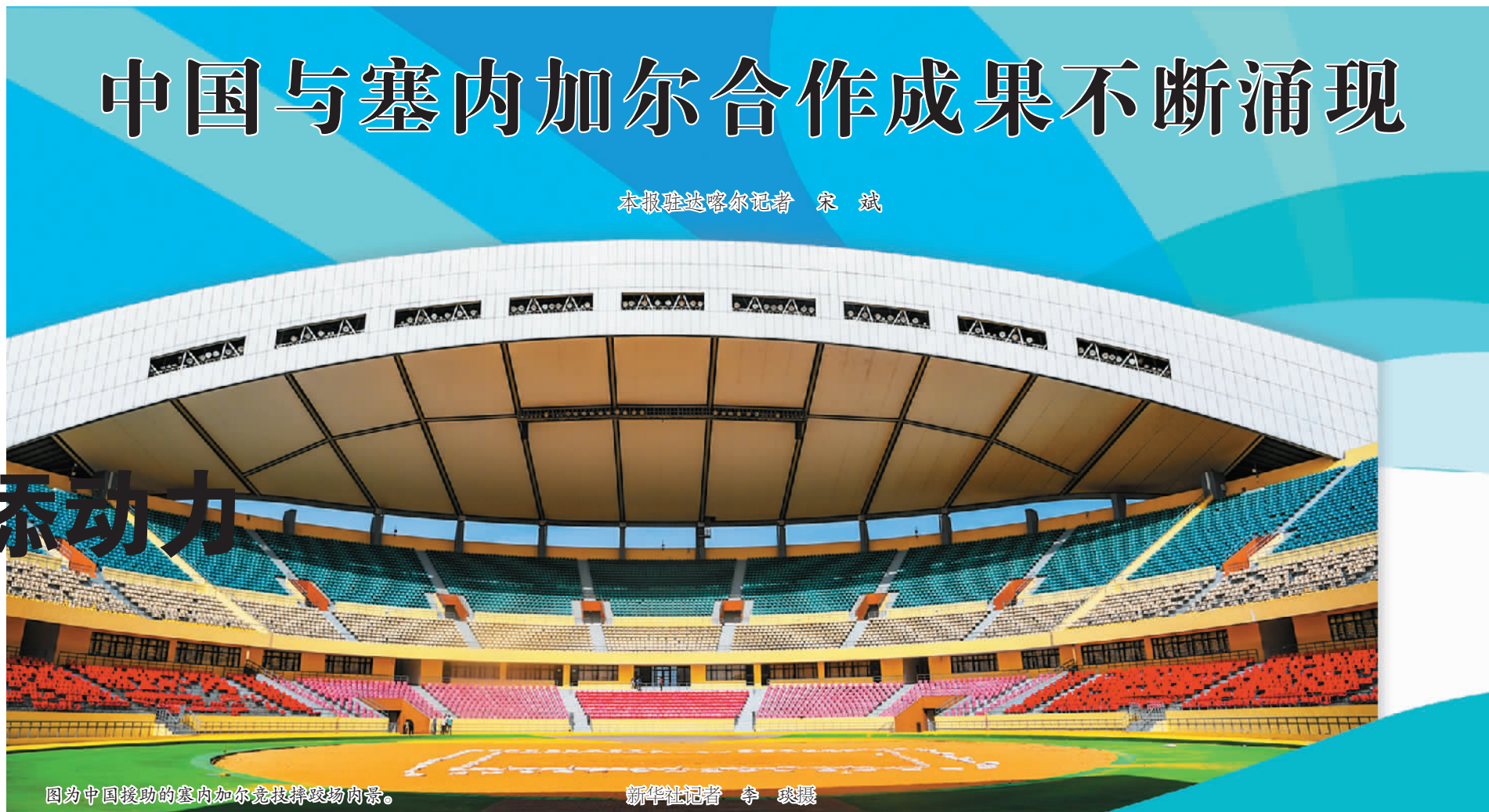
图为中国援助的塞内加尔竞技场建设场景。