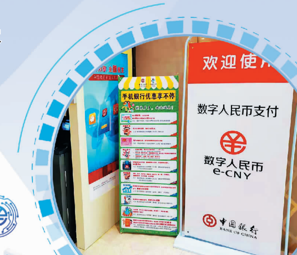
三亚海旅免税城内摆放的数字人民币宣传品。

在博后村,虽然网红民宿都推广了数字人民币使用,但是仍有一些店铺、夜市没有开通。不仅是博后村,三亚不少小摊小店,目前也还是数字人民币推广的空白区。