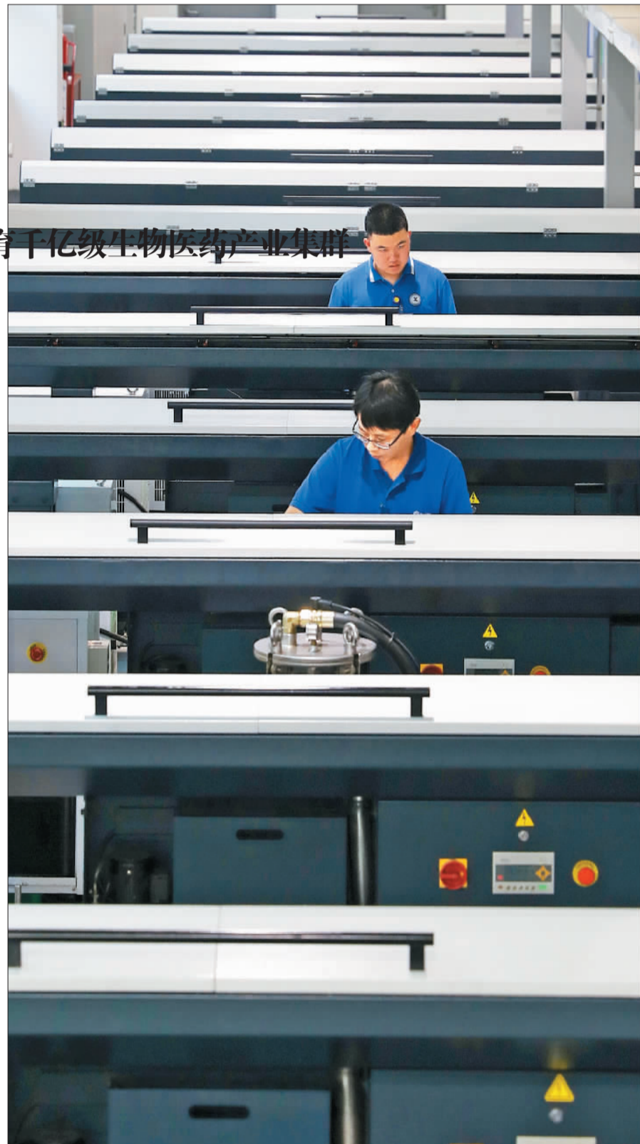
▼位于石家庄市栾城区的神威药业集团有限公司,工人在制药生产线上忙生产。目前,石家庄市已形成了以新型中药制剂为核心的现代中药产业链。

“华北药都”之称,是首批国家生物产业基地之一。新、绿色发展,推动生物医药产业转型升级,加快培育千亿级生物医药产业集群。 本报记者 随着生物医药产业创新能力的持续提升,石家庄市先后被列为“国家高端生物医药战略性新兴产业集聚区”“国家中医药综合改革试验区”“国家康复辅助器具产业综合创新试点地区”,已经建立26家省级生物医药技术创新中心,获批3个国家重点实验室和2个省级重点实验室。“十三五”以来,石家庄市新药临床申报数占河北全省临床申报数的90%以上。 目前,石家庄市已拥有涵盖“研发—孵化—产业化—医药流通”的生物医药全产业链,并形成了以创新药为引领、发酵药物为主导、现代化中药为特色、基因工程药物为先导、医疗器械和医药流通服务为补充的产业体系。 截至2020年底,石家庄市规模以上生物医药企业125家,完成营业收入617亿元。从规模来看,医药工业位居全市主导产业前列,以占全市工业13%的营业收入创造了占全市工业36.5%的利润。