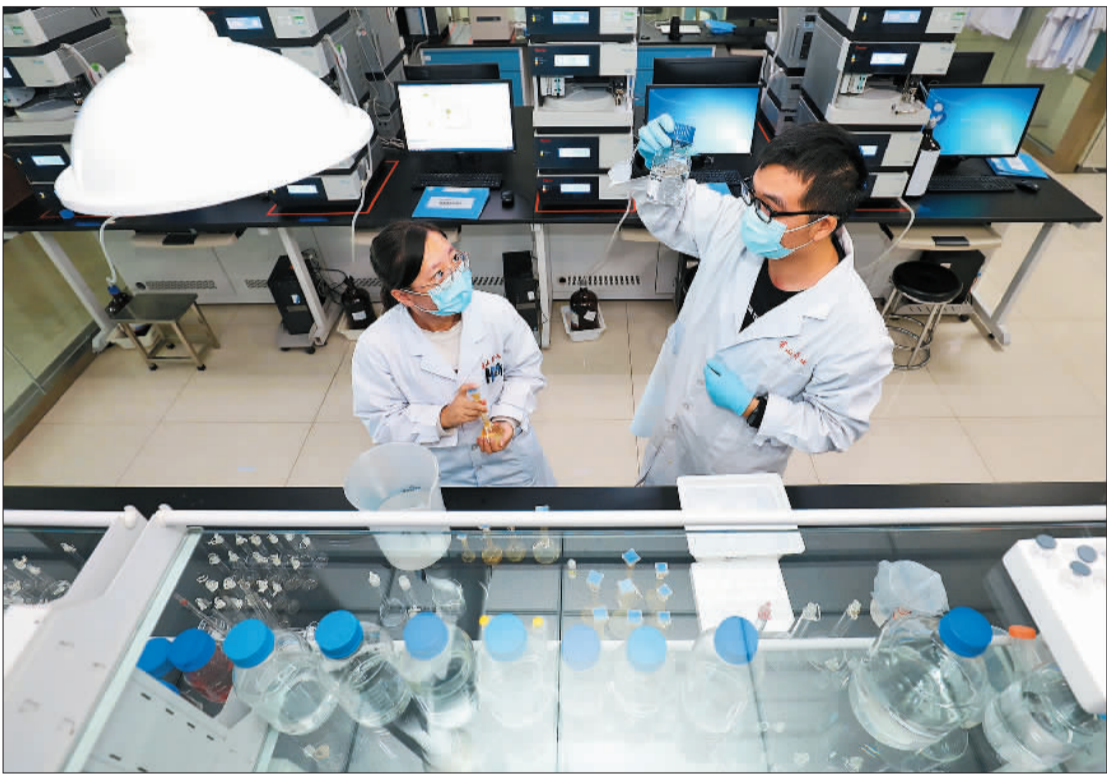
▲位于石家庄市正定县的河北常山生化药业股份有限公司分析实验室,科研人员正在进行实验。该企业拥有完整肝素产品产业链,生产的肝素钙注射液销量连续10年位居国内市场第一位。