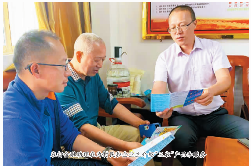
农行金融助理在田间地头为农民和企业介绍“三农”产品和服务

一场场针对金融助理的培训相继展开,内容包括怎样用好“三农”产品政策,如何加强政银联动,“粤菜师傅”“广东技工”“南粤家政”三项工程有哪些金融切入点等等。由于准备充分,金融助理一到镇就紧锣密鼓开展工作,通过走访调研了解镇情、村情、农情。